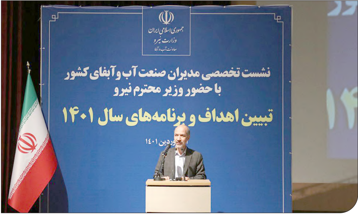
وزارت نیرو | ۱۴۰۱

۹- الزام به تهیه پیوست تأمین اجتماعی برای طرح‌ها و برنامه‌های کلان کشور.