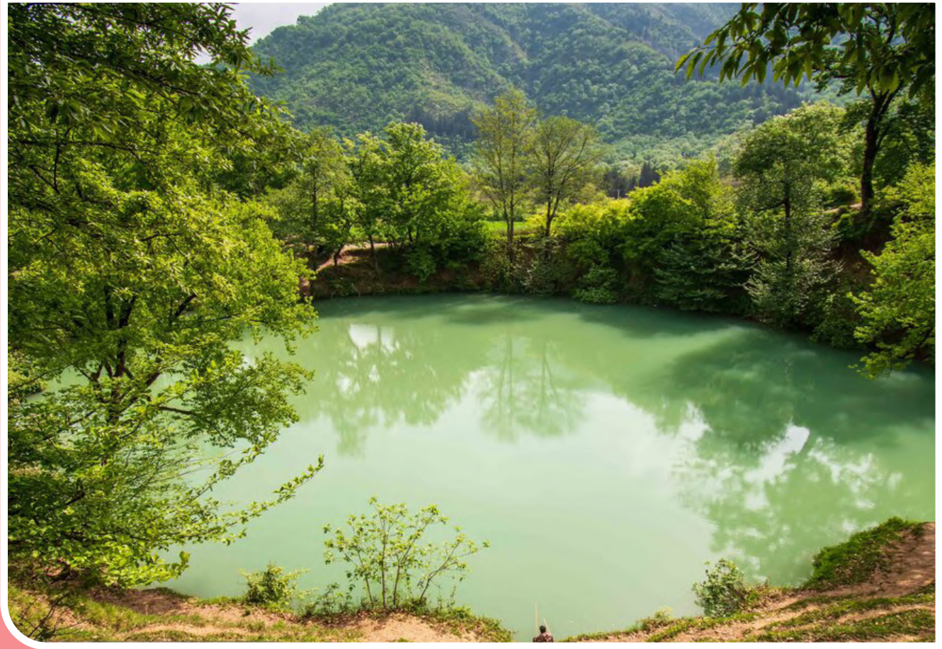
گل رامیان، عمیق ترین چشمه آب سرد جهان - عکس از محمد عطایی / مهر