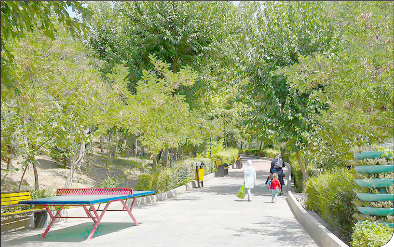
| Infrastructure | (C)

گرد و غبار موجود در هوا تابش خورشید را جذب و پراکنده می‌کند و میزان رسیدن این پرتوها به سطح زمین را کاهش می دهد. گرد و غبار همچنین تشعشعات سطحی با طول موج بلند را جذب می‌کند و آن را در جهات مختلف بازتاب می‌دهد.به این ترتیب به تشدید اثر گلخانه‌ای و گرم شدن بیشتر زمین می‌انجامد. همچنین این توفان‌ها باعث آلودگی هوا می‌شوند. افزایش گرد و غبار یا رسوب بر روی سطح آب اقیانوس‌ها می‌تواند منجر به جذب بیشتر تشعشعات خورشیدی در اقیانوس‌ها شود. این موضوع سطح دریاها را گرم می‌کند و بنابراین می‌تواند دمای منطقه را افزایش دهد و رویدادهای شدید اقلیمی را تشدید کند.در میان عوامل مرتبط با توفان های گرد و غبار که مشکوک به ایجاد غیرمستقیم تغییرات اقلیمی هستند، رسوبات ذرات ریز موجود در هوا و گرد و غبار مواد معدنی در دریاها و اقیانوس هند قرار دارند. در آب‌های خلیج فارس، توفان‌های گرد و غبار عامل اصلی رسوب‌هایی هستند که می‌توانند به صورت لایه ای روی دریاچه‌ها و تالاب‌ها و گاهی اوقات حتی بخش‌های بزرگی از آبراه خلیج فارس را بپوشانند. حتی پل‌های خورشیدی انرژی‌های تجدیدپذیر نیز وقتی با گرد و غبار پوشانده می‌شوند، دچار اختلال می‌شوند. با توجه به این عوامل، آشکار می‌شود که توفان‌های گرد و غبار در یک چرخه معیوب شرکت می‌کنند: تغییرات اقلیمی باعث طوفان می‌شود و توفان اثرهای تغییر اقلیم را تشدید می‌کند. زندگی اجتماعی-اقتصادی حول الگوهای اقلیمی می‌چرخد، بنابراین این معیشت است که به شدت تهدید می‌شود.