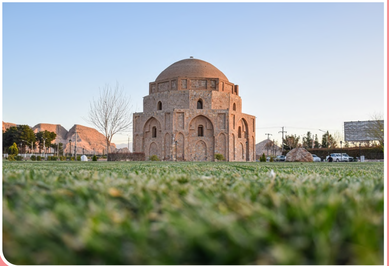
گنبد جلیله در کرمان - عکس از مهلا جنابی / باشگاه خبرنگاران جوان