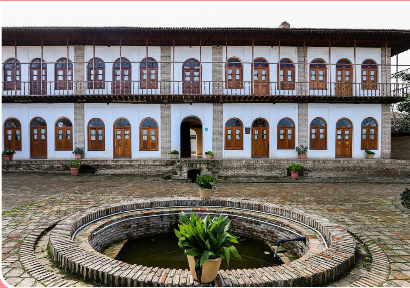
بافت تاریخی شهر گرگان، نخستین بافت تاریخی ثبت آثار ملی در کشور