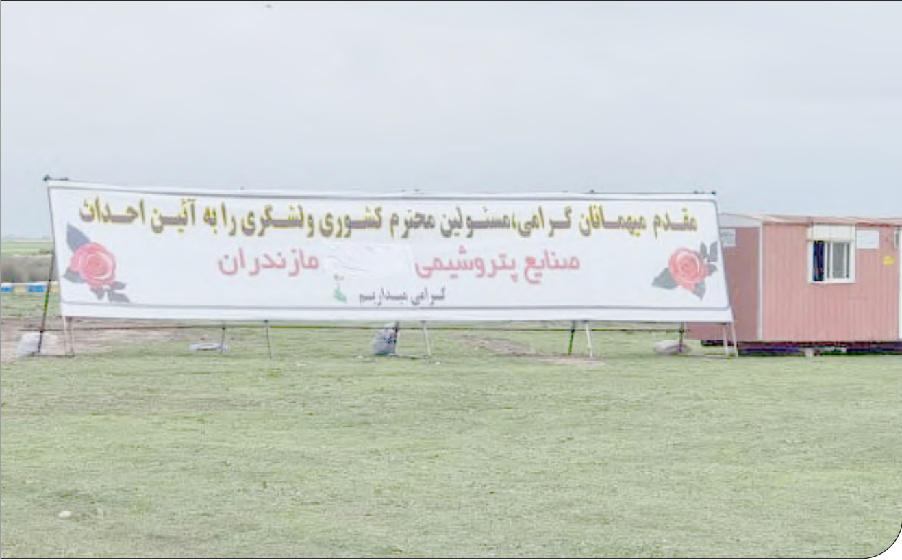
— 9 —