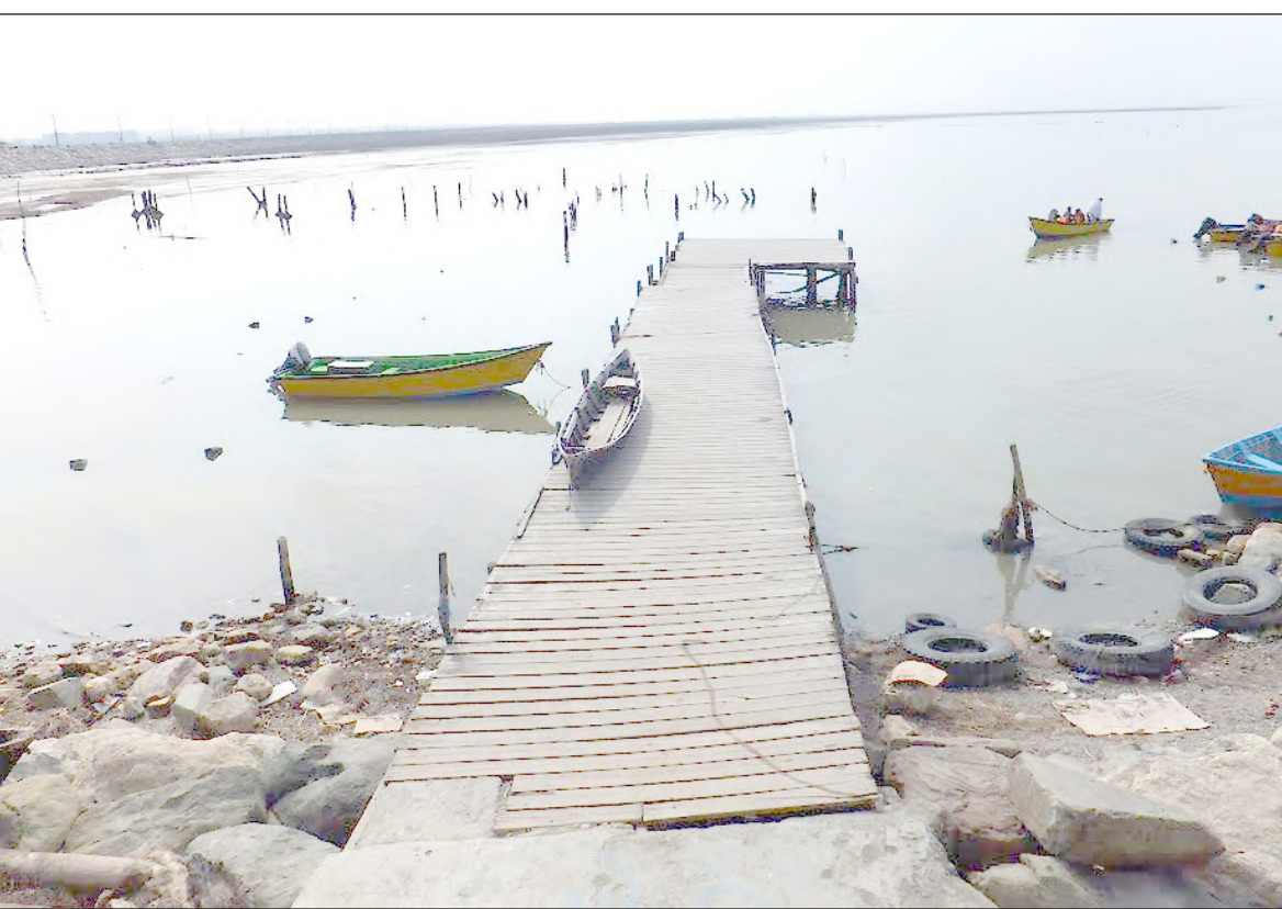
باسنگ، خرمسازان جنوب