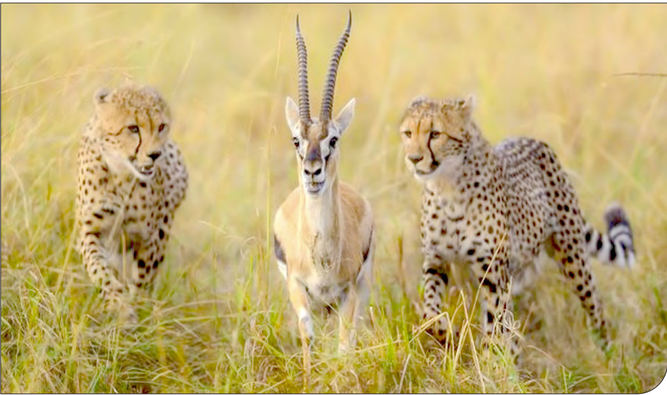
— ۳ —

نبی‌یان، کارشناس حیات وحش: بودجه حفاظت از یک گونه در خطر انقراض در ایران، با قیمت یک آپارتمان در تهران برابری می‌کند