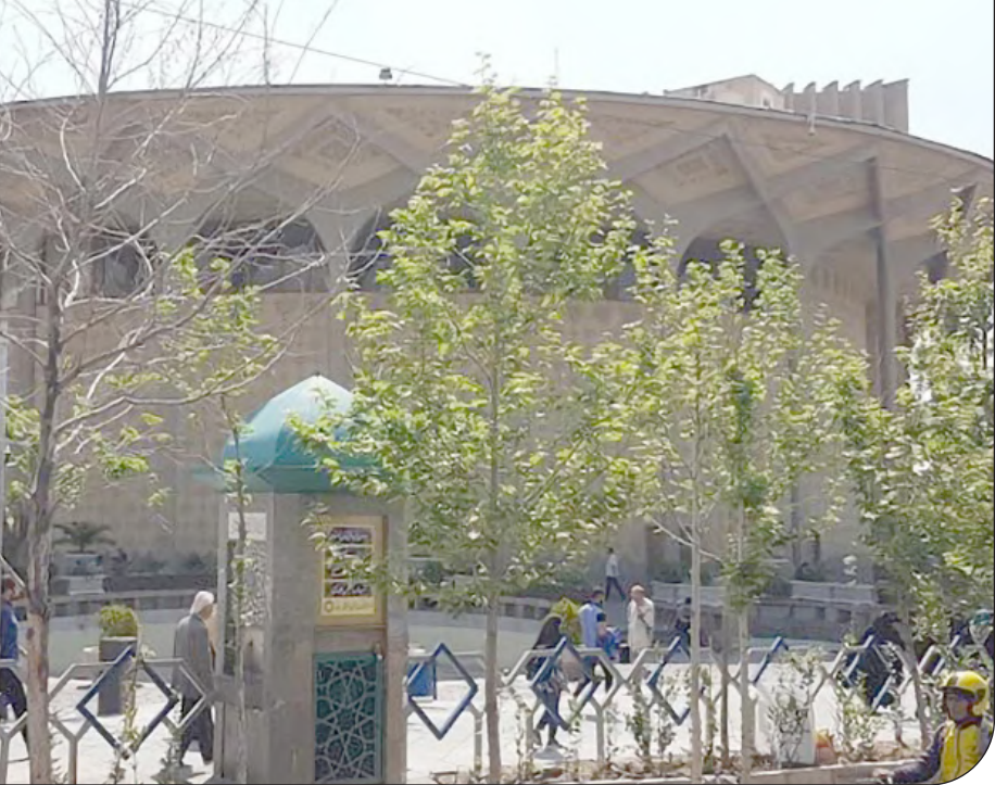
| ایسنا |

رییس پلیس ترافیک شهری راهنمایی و رانندگی با بیان اینکه پلیس دراجرای این طرح با ارتکاب ۱۰ تخلف ازسوی موتورسیکلت سواران برخورد خواهد کرد،گفت:تخلفاتی چون عبور از خطوط ویژه، حمل بارنامتعارف، مخدوش بودن پلاک، نداشتن مدارک، عبور از پیاده رو، انجام حرکات نمایشی و ... از جمله این موارد است. به گفته سلیمی در همان محل توقف موتورسیکلت ها نیز محل هایی در نظر گرفته شد تا راننده در محل آموزش داده شود، موتور سیکلت نیز از یک تا ۱۲ ساعت در همان محل نگهداری می شود و فرد باید مدارک خود را به مانوران ارائه داده و منتهد شود که قوانین و مقررات را رعایت می‌کند.