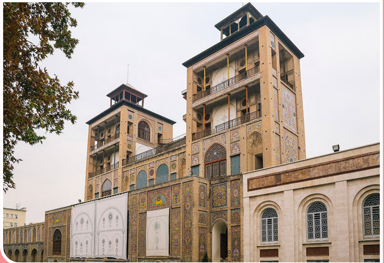
کاخ گلستان از بناهای عهد آقا محمدخان قاجار