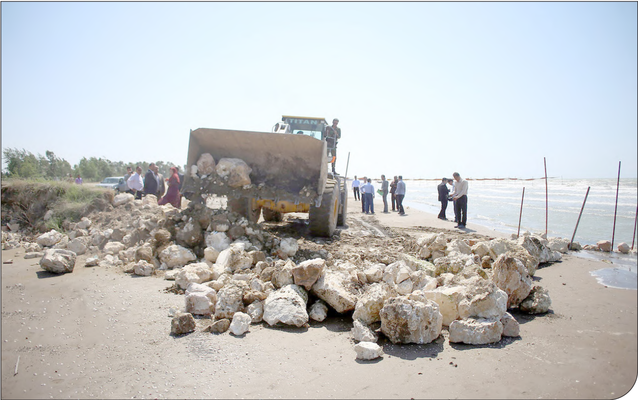
— 403 —