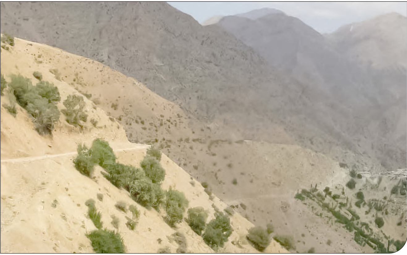
— 34 —

تواضع، فعال محیط زیست: اینکه می‌گویند با احداث جاده مشکل راه ارتباطی چندین روستا حل می‌شود درست نیست. در مسیر رودخانه گوکان، روستایی جزوزوه در کار نیست