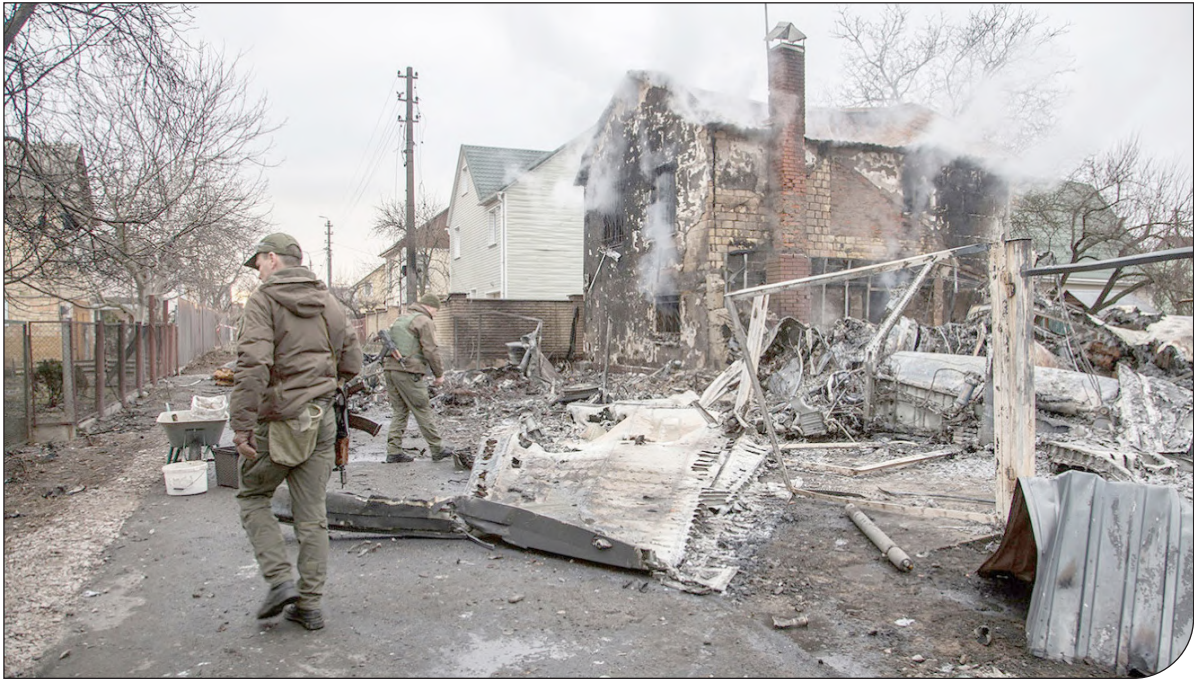
— ۱ —

مردم دنیا هنوز در شوک هستند، انگار با وجود تمامی هشدارها هنوز ترس و ناباوری از سرعت تغییرات و اتفاقات ما را کرخ‌ت کرده و بی‌قدرت می‌نمایان. انگار باز جنگ را باور نمی‌کردیم. نهادهای مدنی باید قدرت را به مردم برگردانند، این باور را به وجود آورند که می‌شود و باید برای کودکان بدون نگاه به مرزها ایستاد، می‌شود و باید پایان جنگ را از تصمیم‌گیرندگان مطالبه کرد، می‌شود و باید همدلی‌های آسانی را همسنگی معنادر با مردمان اوکراین (در اوکراین، و پناهجویان امروز و آینده) تبدیل کرد. اگر یک «طرف دربیست» در جنگ وجود داشته باشد، همین نقطه است. اگر یک «سیاست درست» وجود داشته باشد، همین سیاست است.به قول توماس هاردی شاعر، جنگ همبفکر غریب است، به کسی شلیک می‌کنی که اگر هر کانه‌ای می‌دیدیش، یک نوشیدنی مهمانش می‌کردی.