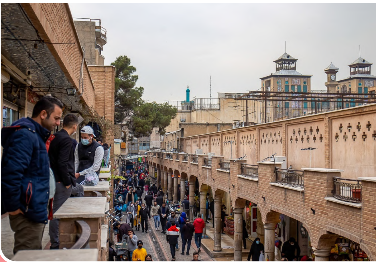
کوچه مروی با قدمتی ۲۰۰ ساله از قدیمی‌ترین معابر شهر تهران