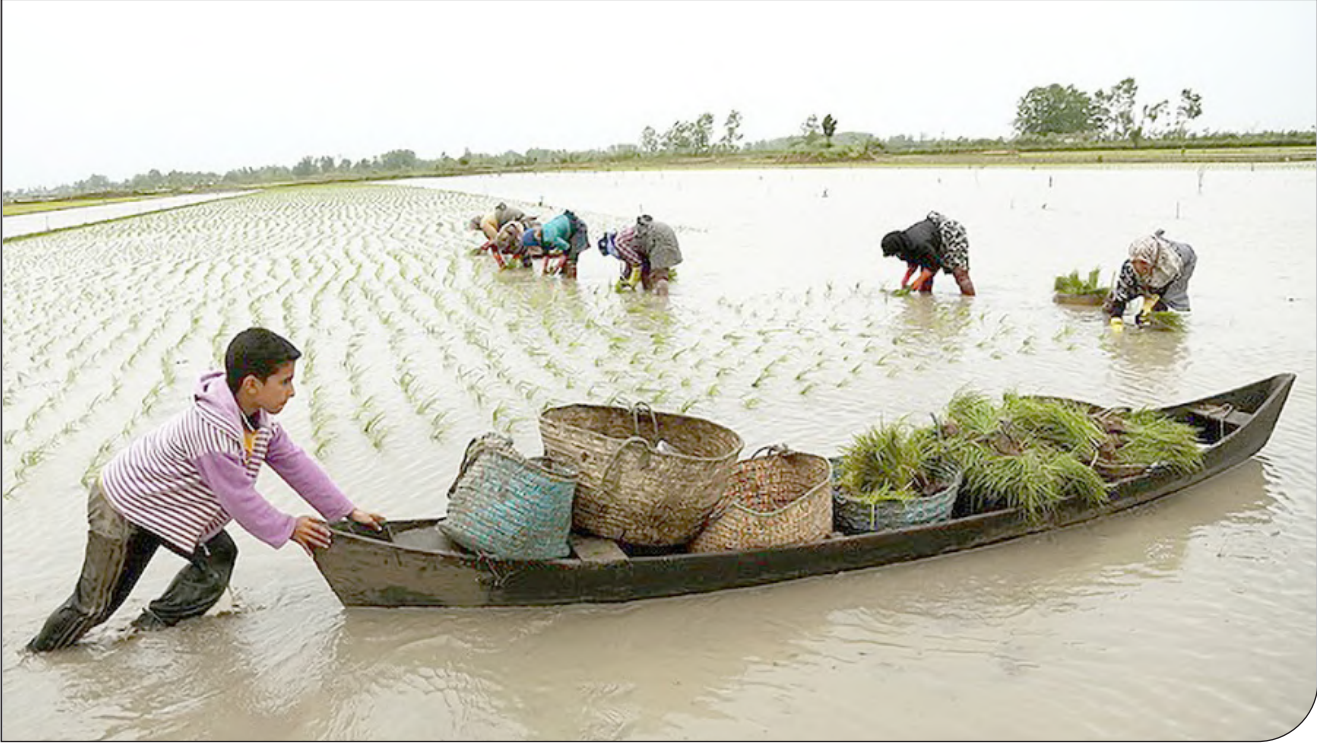
محل آبیاری در استان گلستان

در طرح فعلی از تجارب گذشته در وزارت جهاد کشاورزی و پتانسیل‌های فعلی این وزارتخانه استفاده نشده است