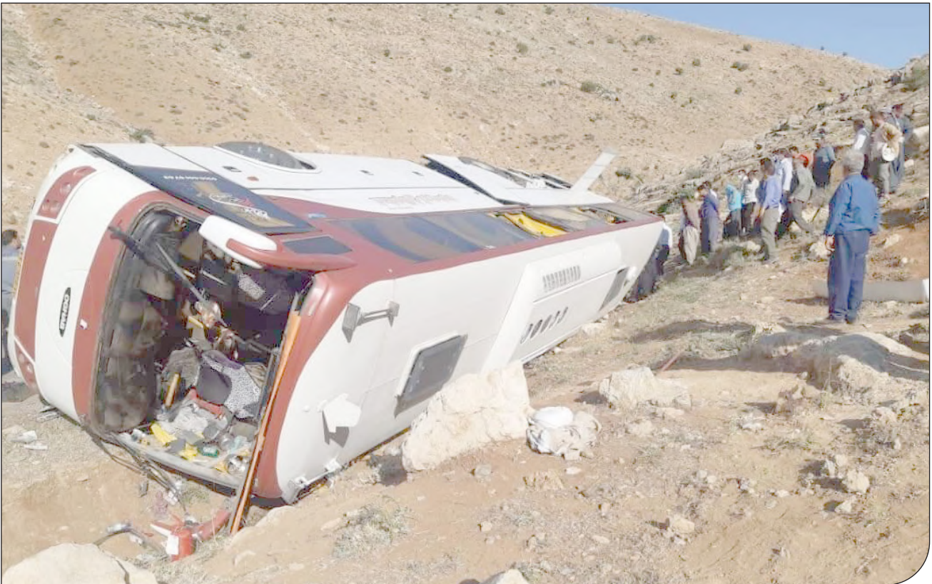
در محل سانحه