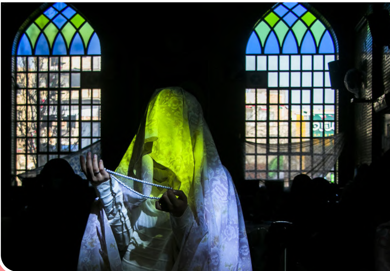
مراسم اعتکاف در مساجد آذربایجان شرقی با حفظ پروتکل‌های بهداشتی

انتشارات ققنوس کتاب «عزازیل» نوشته یوسف زیدان را با ترجمه فریبا فرزناوی منتشر کرده است. به گزارش هنرآنلاین، رمان «عزازیل» ترجمه طومارهایی است که در خرابه‌های باستانی شمال غربی حلب (شهری در سوریه) به دست آمده است. این طومارهای سریانی (آرامی) کهن در نیمه اول قرن پنجم میلادی نوشته شده‌اند ولی زمان پیدا شدن کیفیت خوبی داشتند. این کتاب از سی طومار با عناوین «آغاز نگارش»، «خانه خدا»، «مرکز تجارت سنگ‌نمک و سنگدلی»، طومار چهارم «افشاگری‌های اوکتاویا»، طومار پنجم «افواگرهای اوکتاویا»، «نقطه جدایی»، «طومار ناقص»، «آنزوا در میان صخره‌ها»، «خاوه‌رسی»، «اوارگی»، «دنباله ماجرای اورشلیم»، «سفر به دیر»، «دیر آسمانی»، «خوشبیدهای درون»، «فریسی اقنومی»، «بورش گذشته»، «ابستخ خدا»، «در حاشیه سرمد»، «بانو»، «نگرانی در همسایگی»، «کاروان»، «پیدایش توفان»، «وزش توفان»، «افق عشق»، «اشتیاق»، «رویداد ممنوع»، «پتک»، «حضور»، «محرمیت» و «قانون ایمان» تشکیل شده است.