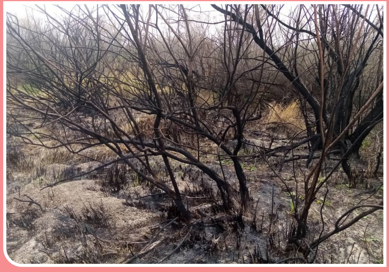
آتش بر جان طبیعت درختان گز - روستای بنه‌عیاس بخش سلطان‌آباد شهرستان رامهرمز