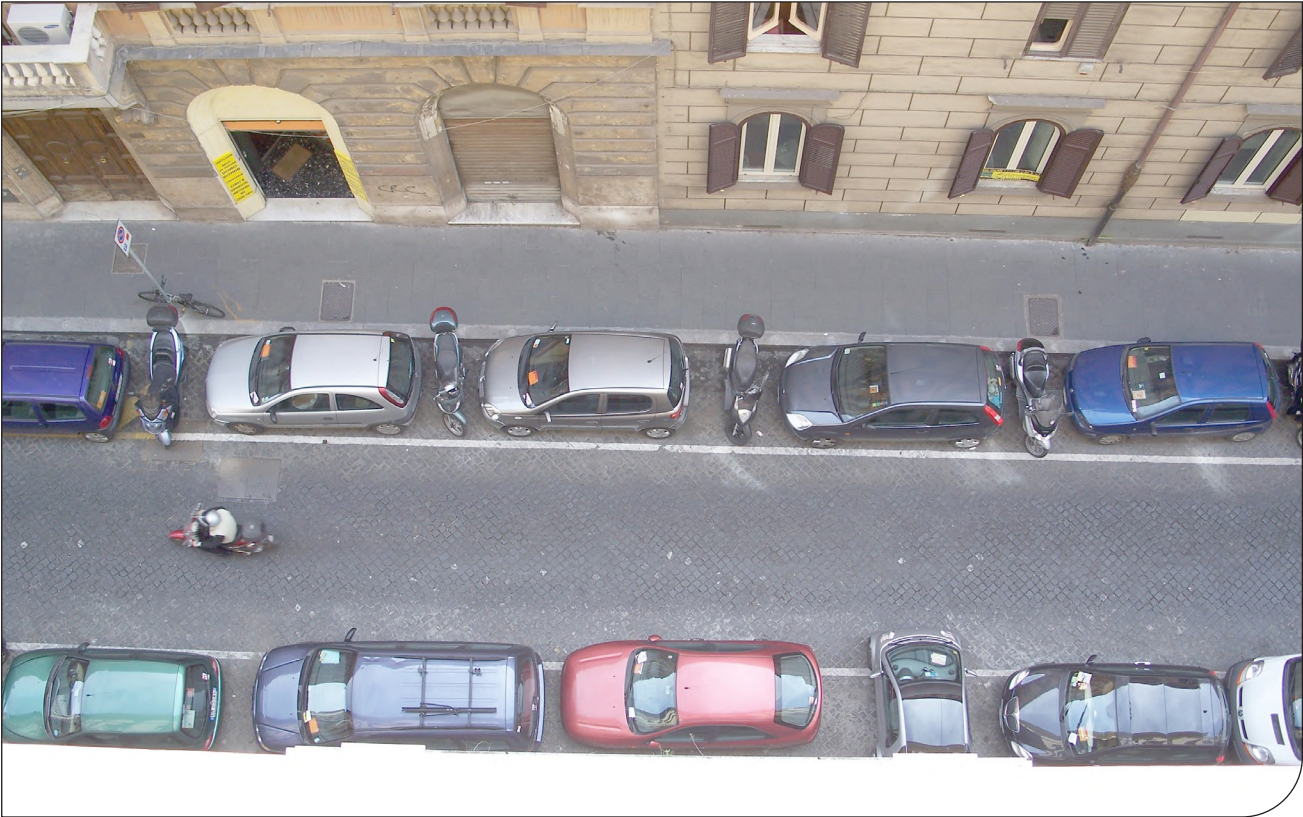
یکمیدو جای پارک در خیابان های پاریس