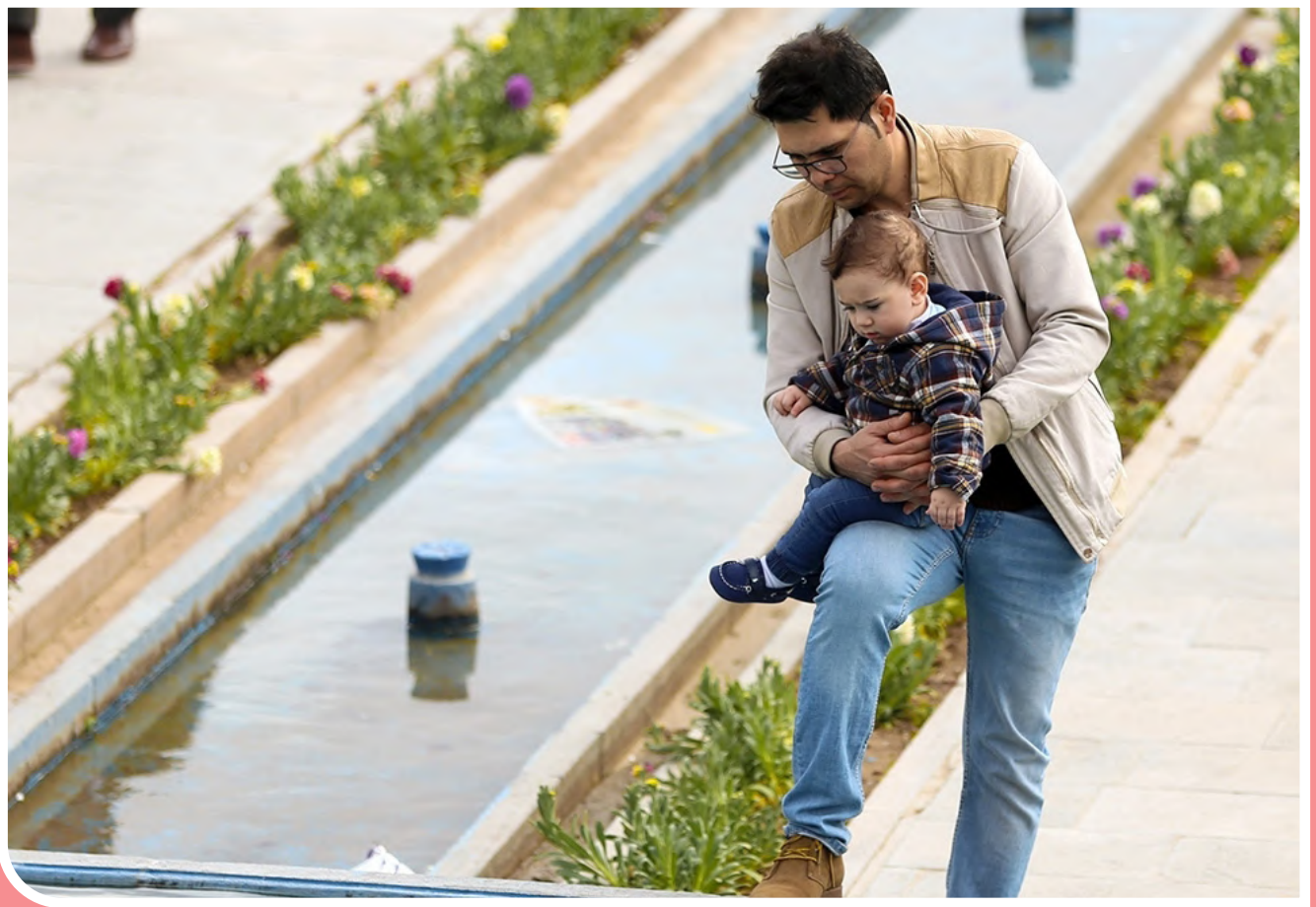
پدر: تکیه‌گاه امن