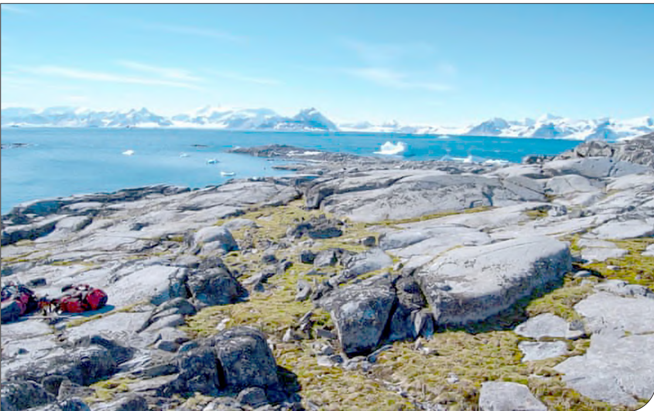
— Nicoletta Cammone

افزایش دمای زمین، آب شدن یخ‌های قطبی و کاهش جمعیت فک‌های خزپوش باعث رشد بیشتر گیاهان بومی شده است