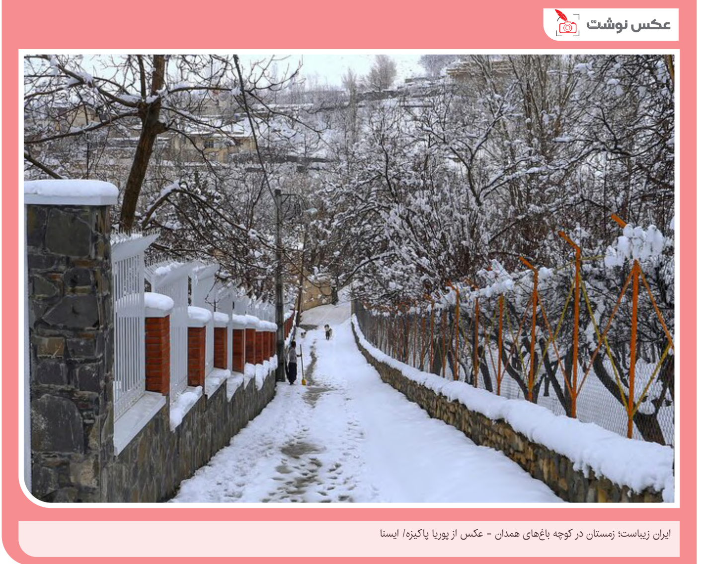
ایران زیباست: زمستان در کوچه باغ‌های همدان

سینما مراسم اعطای جوایز آدمی فیلم اسپانیا (گویا) با اعطای جوایز اصلی به فیلم «رئیس خوب» با بازی «خاویر باردِم» برگزار شد. به گزارش ایسنا، سی‌وششمین دوره جوایز سینمای گویا موسوم به اسکار سینمای اسپانیا برگزار شد و فیلم «رئیس خوب» ساخته «فرناندو لئون د آراتانو» که در ۲۰ رشته نامزد کسب جایزه بود در نهایت بیشترین جوایز از جمله بهترین فیلم، کارگردانی، بازیگر مرد (خاویر باردِم)، فیلم‌نامه اصلی، تدوین و موسیقی متن را به خود اختصاص داد. «رئیس خوب» امسال نماینده سینمای اسپانیا در شاخه بهترین فیلم بین‌المللی اسکار ۲۰۲۲ بود و توانست به جمله فهرست کوتاه ۱۵ نامزد اولیه این شاخه راه یابد. «خاویر باردِم» بازیگر اصلی فیلم «رئیس خوب» و «فرناندو لئون د آراتانو» هر کدام توانستند مجموع تعداد جوایز خود را از مهم‌ترین جوایز سینمای اسپانیا به عدد ۷ برسانند.