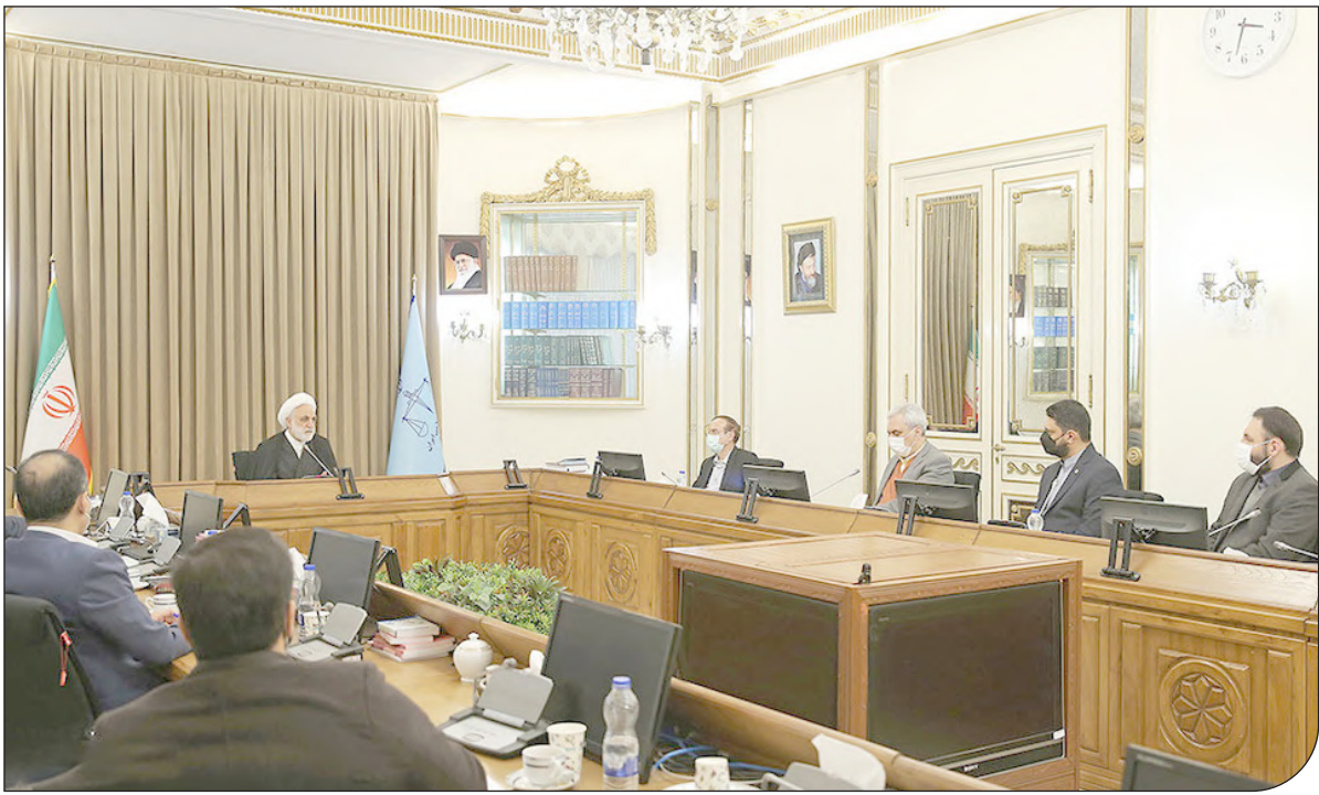
— شورای —

سال شانزدهم | شماره پیاپی ۲۲۳۰ | دوشنبه ۲۵ بهمن ۱۴۰۰ |