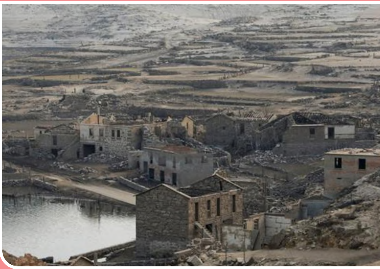
ظهور دهکده ارواح در اسپانیا پس از خشکسالی