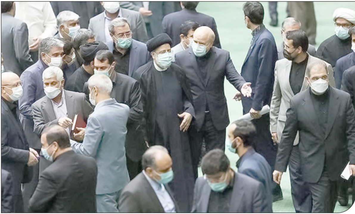
بازنشر فایل صوتی جنجال به پا کرد.