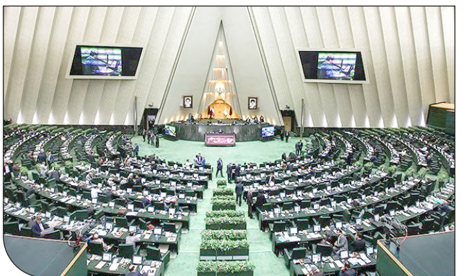
مجلس شورای اسلامی در حال برگزاری جلسه است.

شفافیت آرا قرار گرفت یا حداقل مخالفتی با این طرح نکرد، در مجلس دهم ناشی در میان منتقدان این طرح بود. او در بخش پایانی اظهاراتش تاکید کرد: «در صورتی که طرح شفافیت آرا مجددا از سوی نمایندگان رد شود، طرح به‌طور کلی از دستورکار مجلس خارج می‌شود.» این در حالیست که براساس آیین‌نامه داخلی مجلس شورای اسلامی، حتی در صورت رد کلیات این طرح هم نمایندگان ۶ ماه بعد می‌توانند همین طرح را با عنوانی متفاوت در دستور