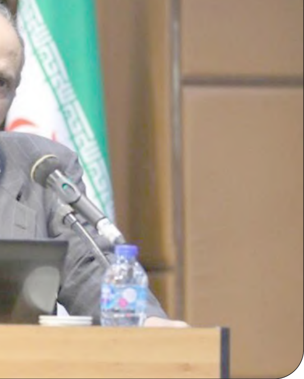
— خطیب —

باستان‌شناسان موفق شدند شمار بیشتری از سربازان «ارتش سفالین» مشهور چین را کشف کنند. به گزارش ایسنا و به نقل از انشتن اورینجینز، باستان‌شناسان با کاوش در شهر «شان‌ه» موفق شدند ۲۰ سرباز دیگر «ارتش سفالین» تاریخی چین را کشف کنند. این مجسمه‌های جدید در گودال شماره یک که خارج از مقبره مخفی امپراتور واقع شده کشف شدند و در وضعیت مناسبی قرار دارند. در بین این مجسمه‌ها که به تازگی کشف شده‌اند یک زن‌رآ و یک افسر ارتش نیز به چشم می‌خورند. گودال شماره یک که ملو از پیاده‌نظام و اراهه است مساحتی معادل ۱۴٬۲۶۰ متر مربع را در بر گرفته است. انتظار می‌رود با پایان کاوش در این بخش، بیش از شش‌هزار مجسمه سرباز شی هوانگ» در زندگی پس از مرگ ساخته شد و تنها مجموعه مجسمه‌های نظامی جهان محسوب می‌شود که در این تعداد زیاد ساخته شده است. «چین سی هوانگ» به عنوان نخستین امپراتور، چین را متحد کرد. گمان می‌رود این امپراتور ارتشی متشکل از ۵۰۰هزار مرد را در اختیار داشته است. در اسناد تاریخی چین به «ارتش سفالین» و یا لیلی ساخته آن هیچ اشاره‌ای نشده است. محققان معتقدند ۲۰۰هزار کارگر طی ۳۰ تا ۴۰ سال ساخت «ارتش سفالین» و مقبره را به اتمام رساندند. «ارتش سفالین» برای نخستین‌بار در سال ۱۹۲۴ توسط کشاورزانی کشف شد که قصد داشتند چاهی را در فاصله کمی از مقبره این امپراتور حفر کنند. در نتیجه آن‌ها سرداب‌های کشف‌کردند که هزاران مجسمه نظامی بی‌نظیرا که دربعاد انسان‌های واقعی ساخته شده بودند و برای مبارزه آماده بودند کشف کردند.