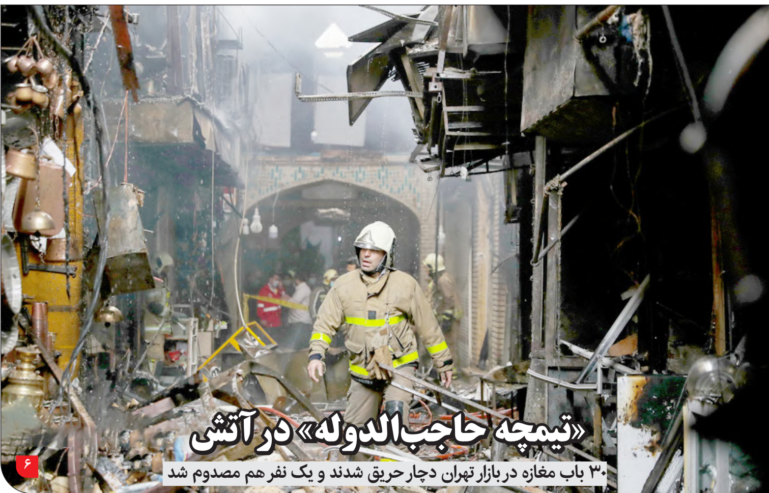
«تیمچه حاج‌الدوله» در آتشی

مدیرکل محیط زیست استان کرمان: باید مشخص شود که چطور بدون مجوز محیط زیست به این معدن مجوز بهره‌برداری داده‌اند