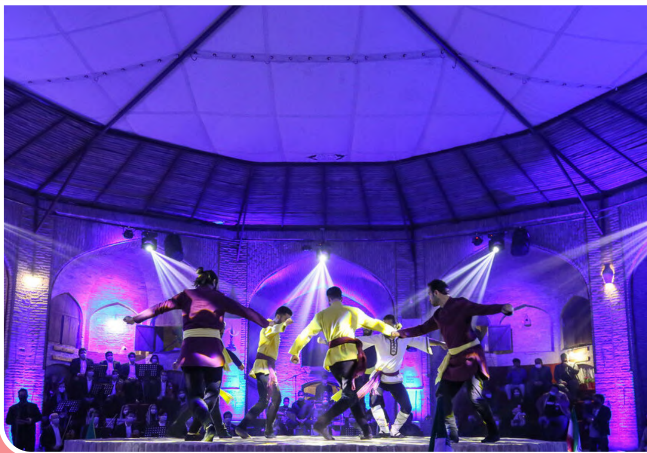
آیین افتتاحیه چهلمین دوره جشنواره تئاتر فجر