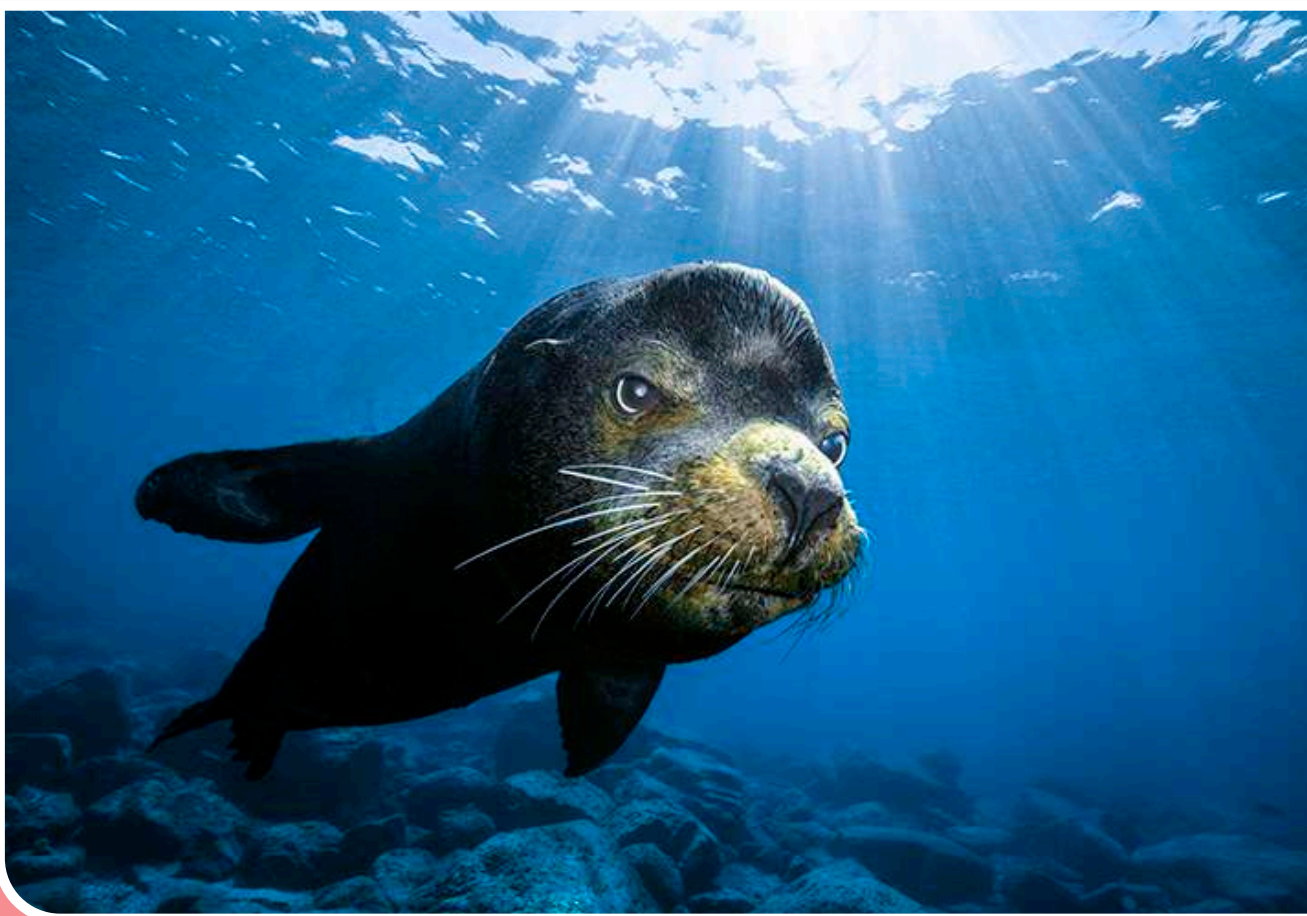
یکی از تصاویر برگزیدگان منتخبان مسابقه عکاسی زیرآب ۲۰۲۱