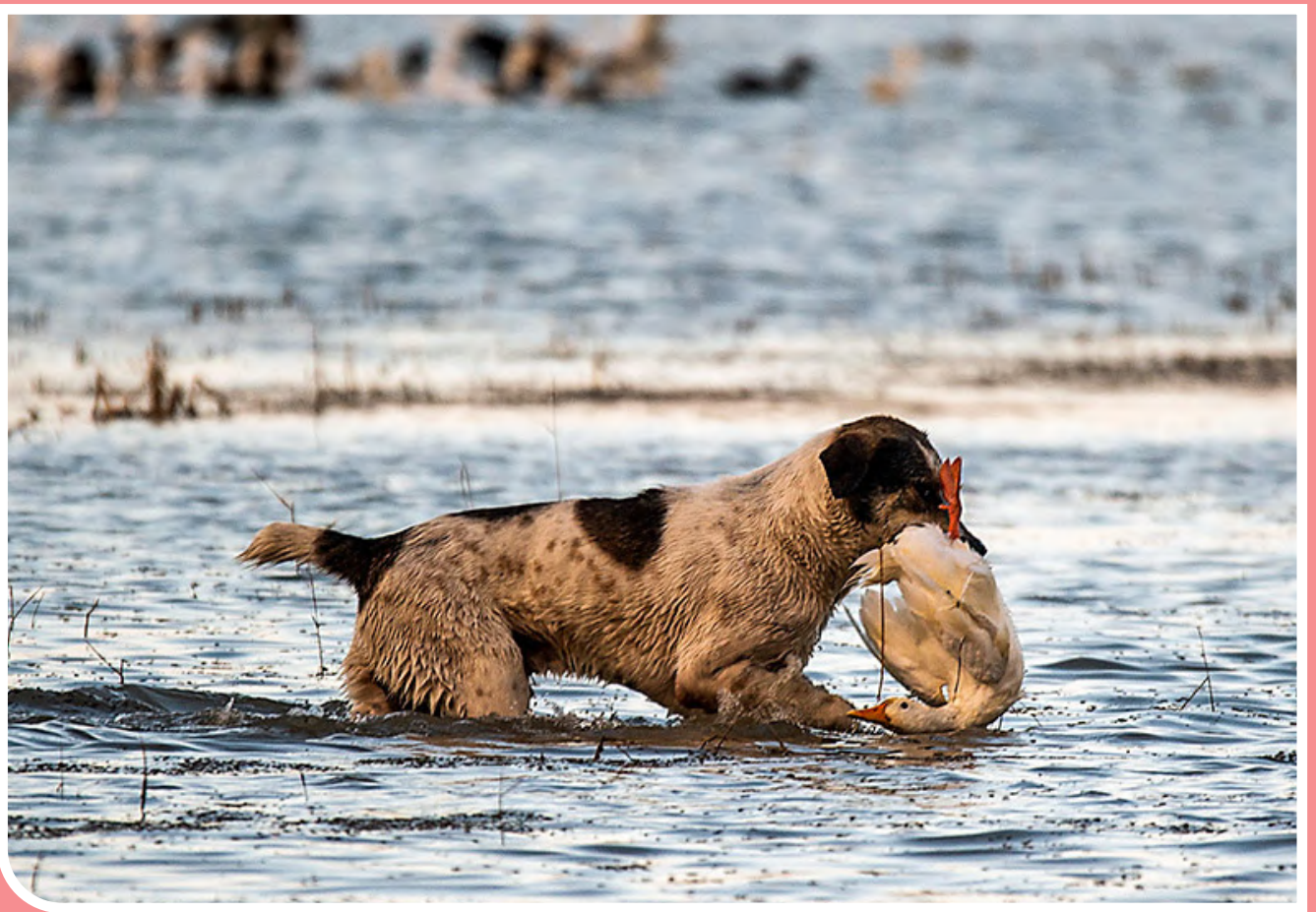
سگ‌های ولگرد آفت محیط زیست مازندران