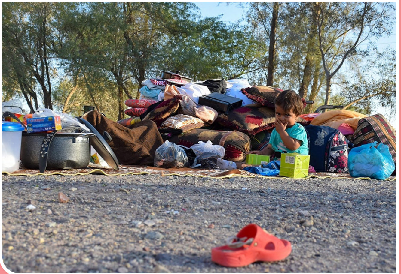
زندگی پس از سیل، کرمان