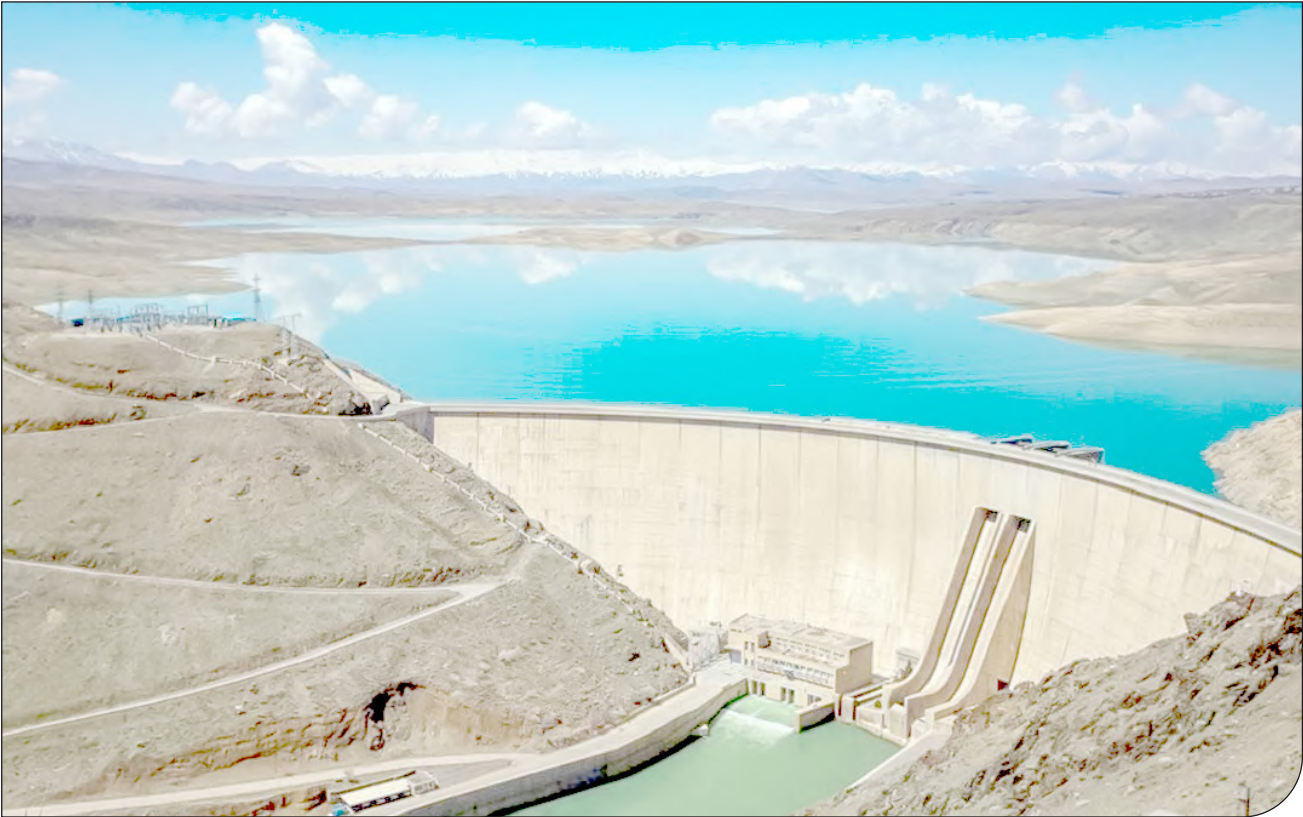
بهره‌برداران سدهای مخزنی از طریق اتخاذ منحنی فرمان هوشمند می‌توانند حیات دوباره را به رودخانه‌ها بازگردانند

او با بیان اینکه آیین سده، جشن احترام به یکی از بزرگترین آفرینش‌های پروردگار یکتا و بی‌همتاست، آتش را پدیده‌ای دانست که بدون آن امکان پیشرفت بشریت، علم و فناوری وجود نداشته و این جشن را متعلق به کل انسان‌ها دانست.