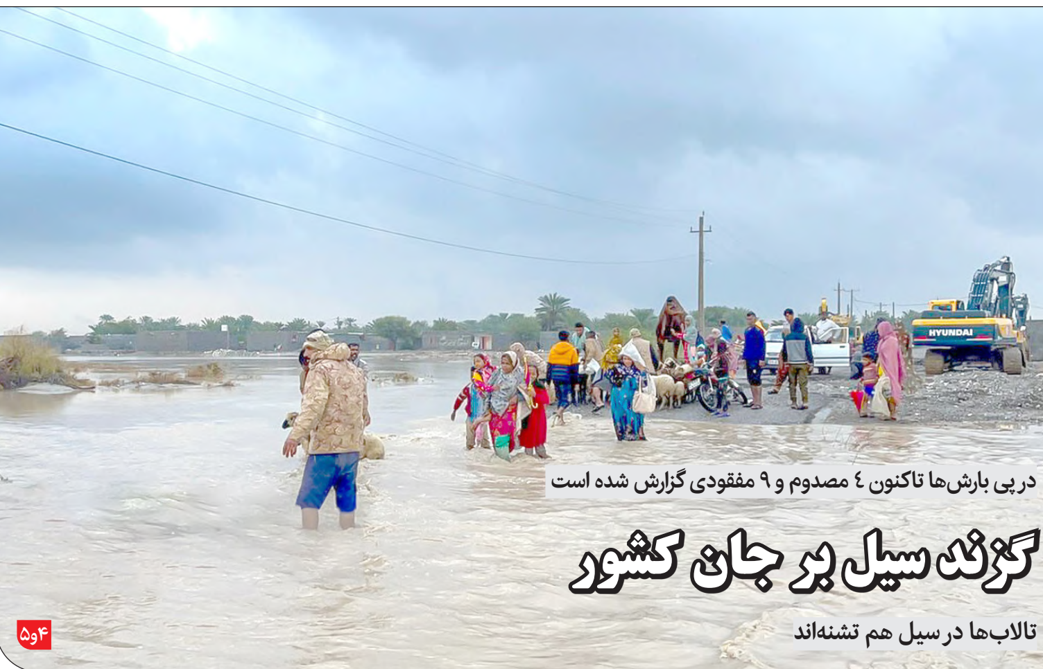
در پی بارش‌ها تاکنون ۴ مصدوم و ۹ مفقودی گزارش شده است

تمامی خودروهای داخلی و وارداتی باید مشمول پرداخت عوارض آلایندگی شوند