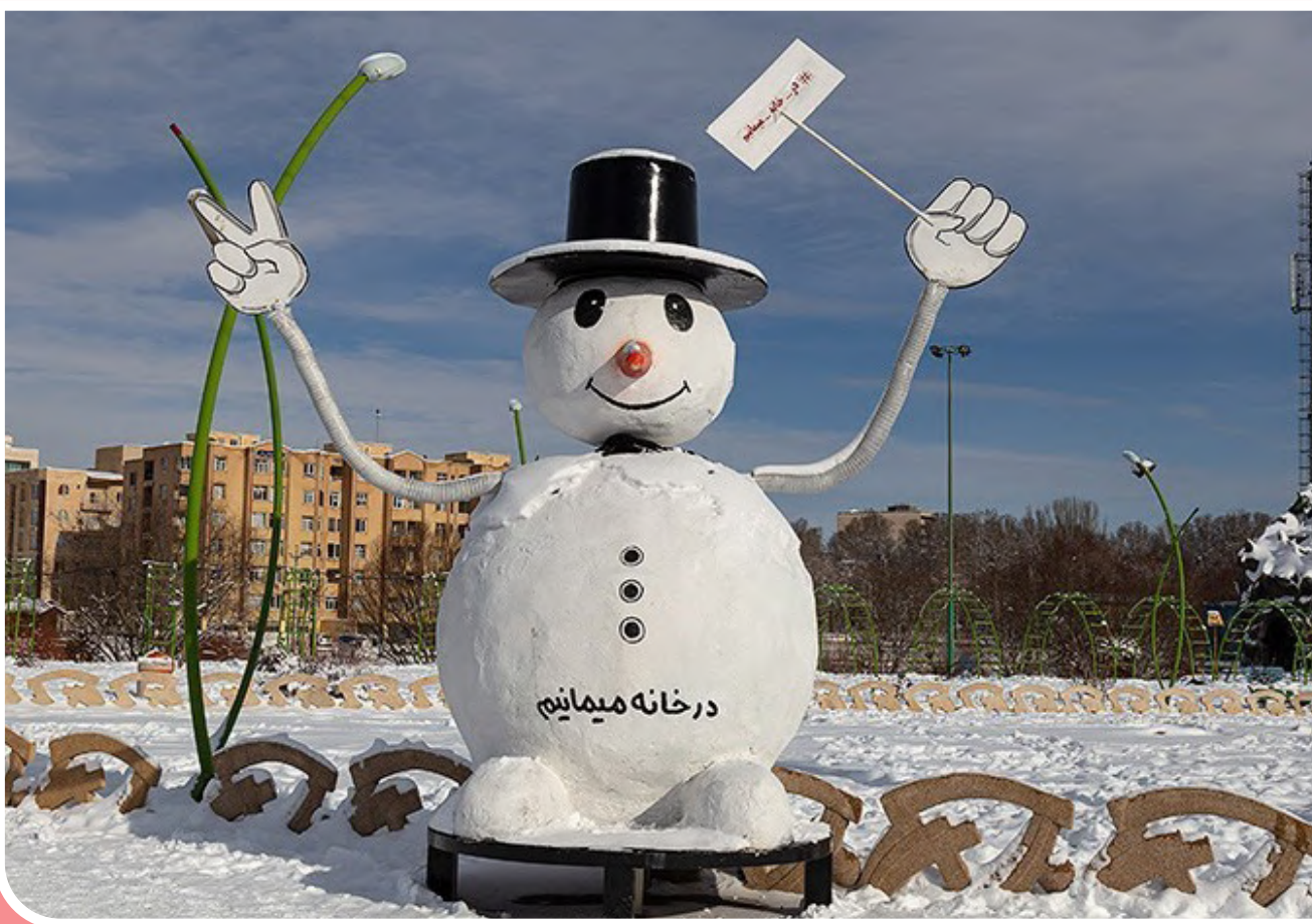
برف و کولاک شدید در اردبیل