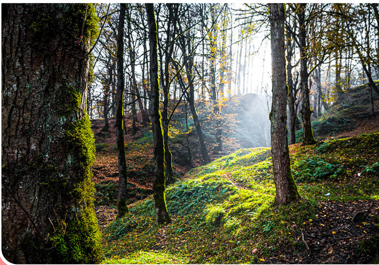
جنگل دالغانی در مازندران