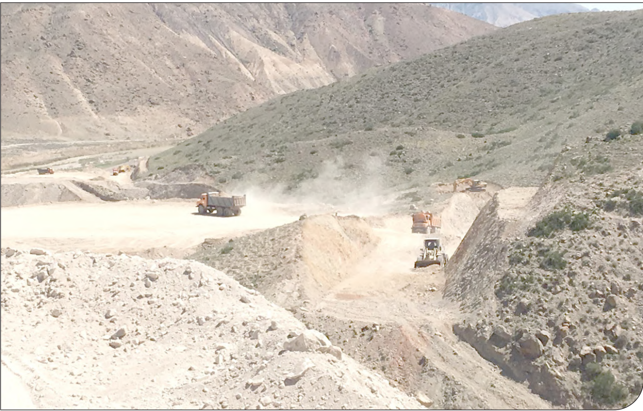
— ۳ —

مخالفت با اختصاص ردیف بودجه به پروژه‌های بدون ارزیابی محیط زیستی با همراهی رئیس سازمان حفاظت محیط زیست جدی‌تر شد