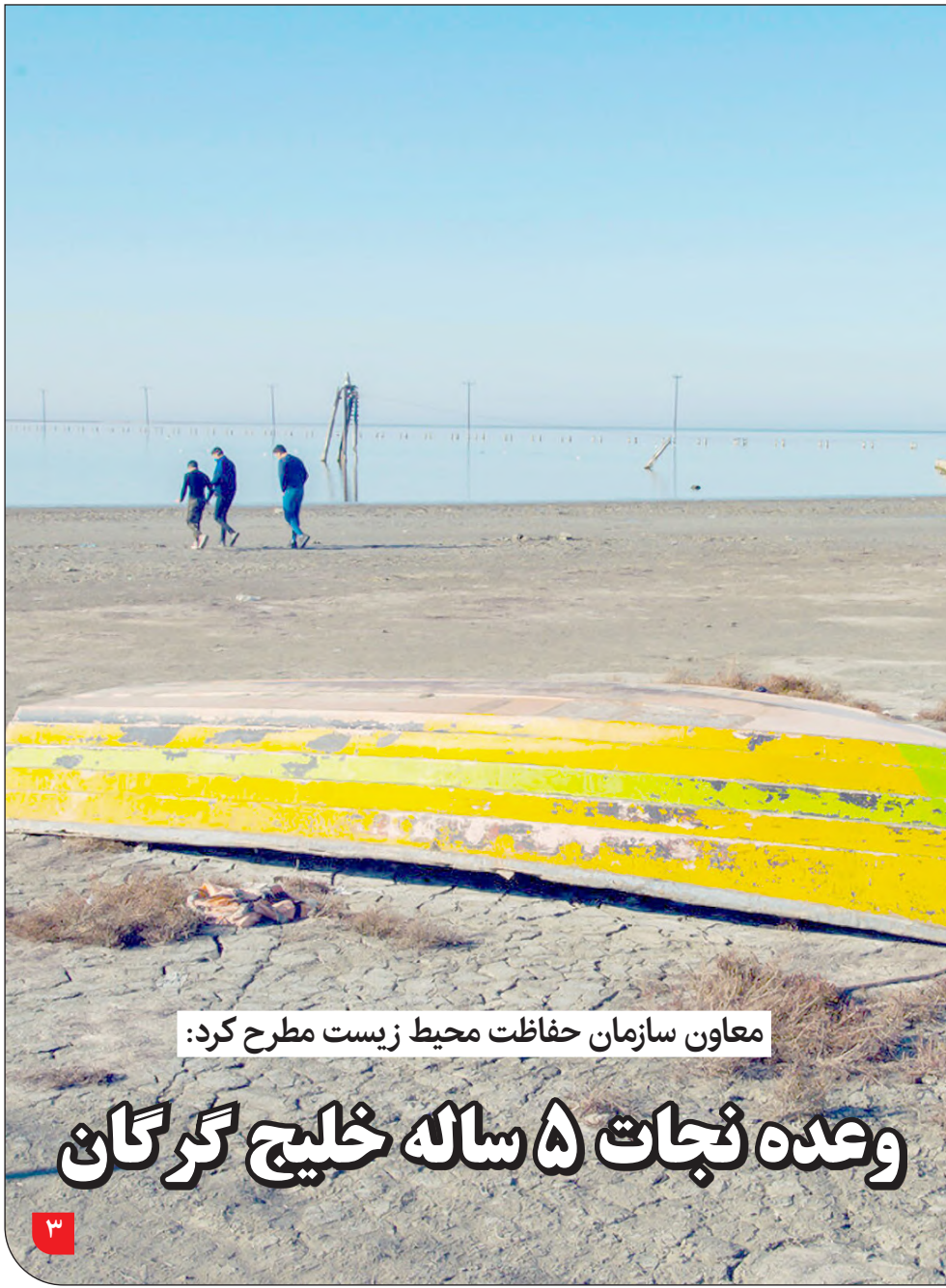
معاون سازمان حفاظت محیط زیست مطرح کرد: