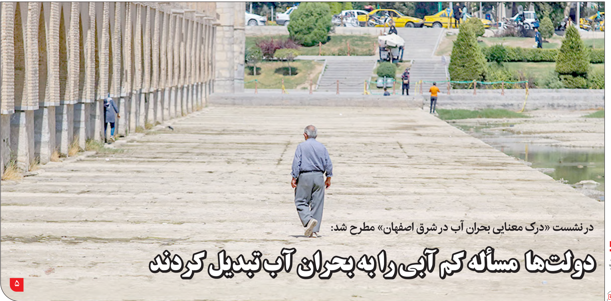
در نشست «درک معنایی بحران آب در شرق اصفهان» مطرح شد:

فرماندار کهنوج: فعالیت معدنی در این نقطه بی‌آسیب است