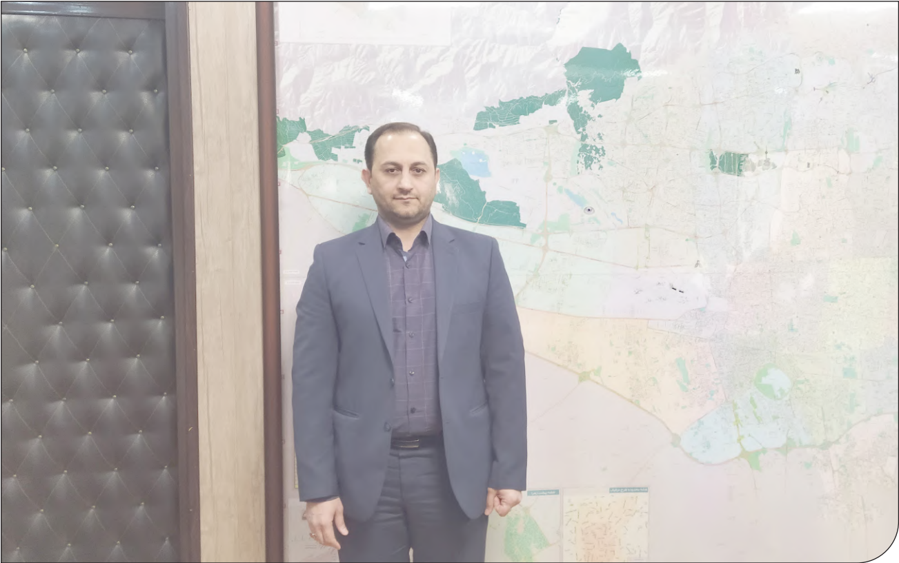
— 17 — پیام — 17