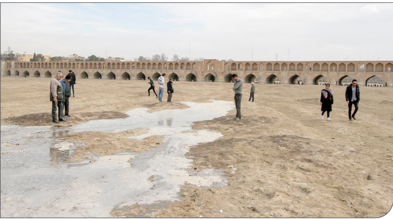
نمای کلی از سد کهریزک در استان اصفهان

بین ساخت سیاسی و ساخت اجتماعی در خصوص بحران آب در ایران شکاف ادراکی وجود دارد