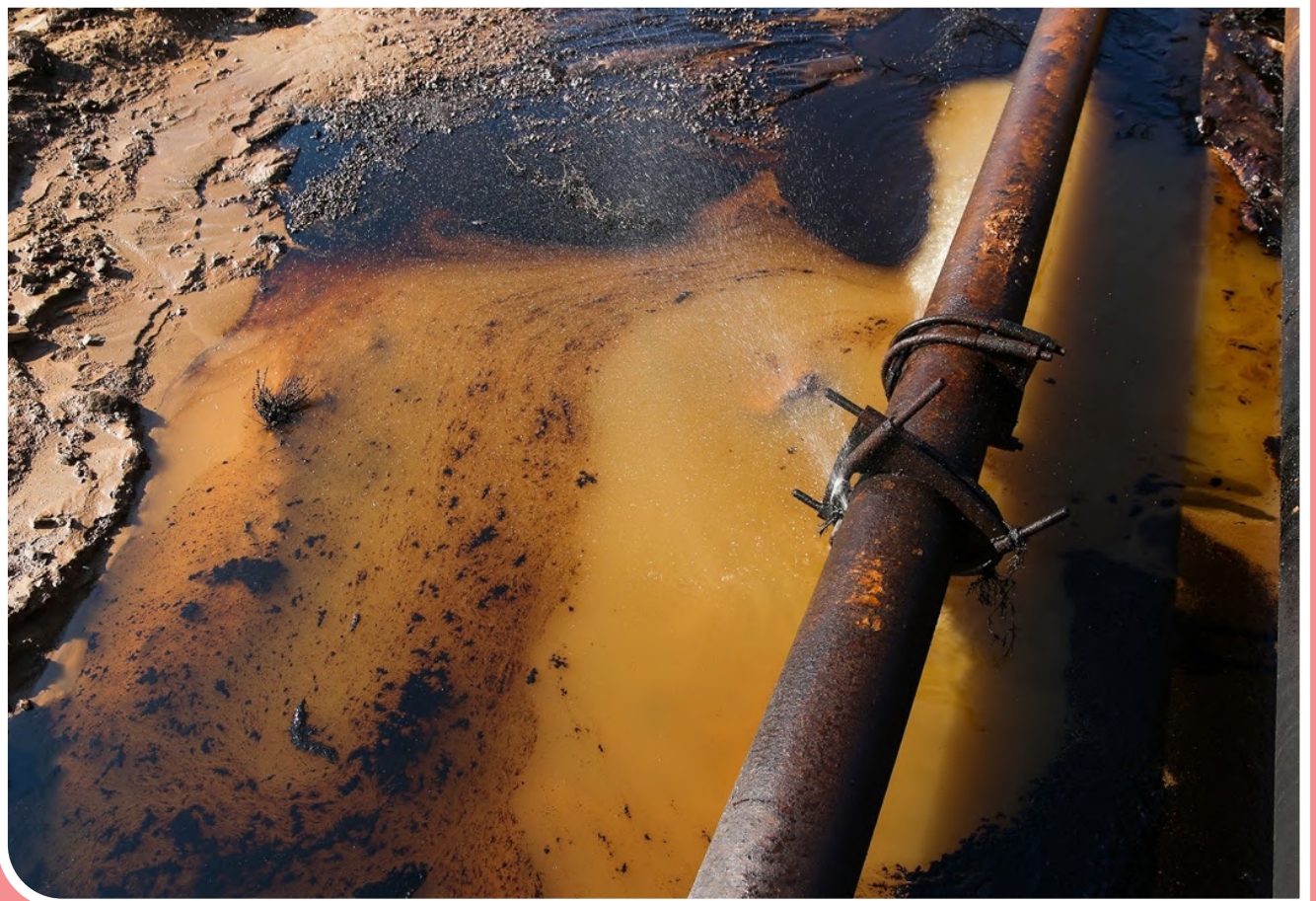
آلودگی در خط انتقال پساب چاه نفت ۳۶۵ مارون