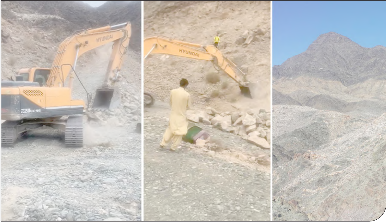
- ۳ -