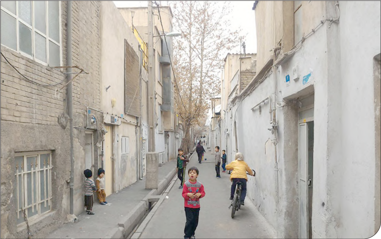
| تاریخ | | تاریخ |