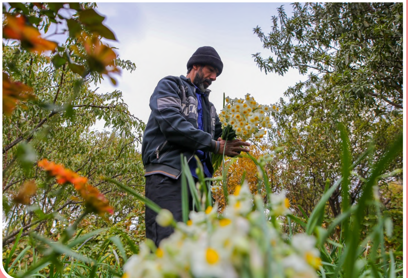
برداشت گل نرگس در شهرستان خفر