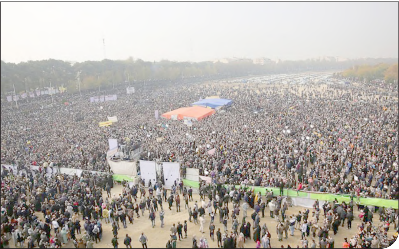
— ۳ —

رئیس سابق مرکز امور اجتماعی آب و انرژی: انحلال مرکز قطعا اتفاق خوبی نیست، اما بدتر از آن این است که نظام فنی و اجرایی کشور اهمیتی به رویکردها و توصیه‌های آن ندهد