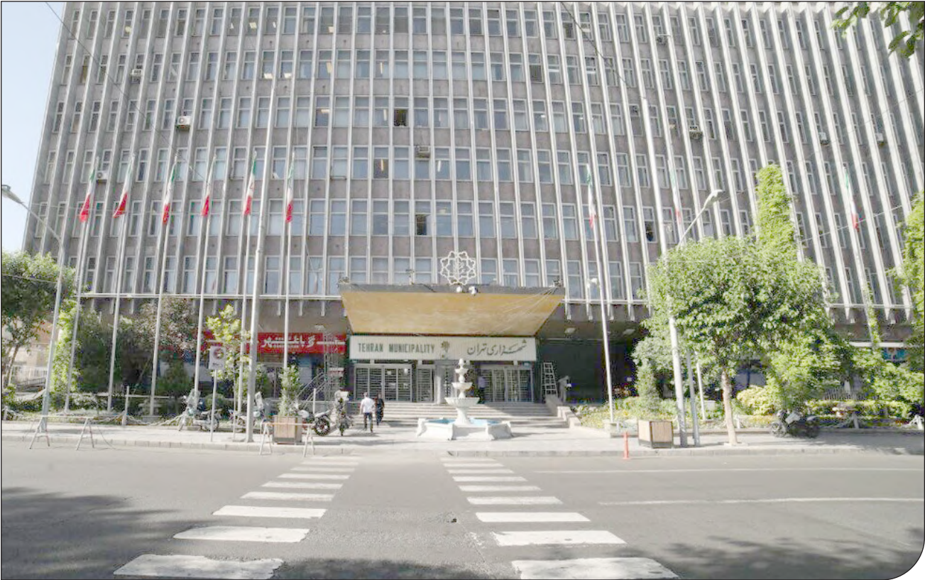
- تهران - شهرداری

او در ادامه نوشت: «در این دستورالعمل ضمن توجه به هماهنگی بین دستگاه‌های نظارتی و برنامه ریزی در برخورد با تخلفات و مفاسد، اصلاح ساختارها، فرآیندها و رویه‌ها به نحوی که زمینه تخلف را کاهش دهد و همچنین استفاده از همه ظرفیت‌ها خصوصا ظرفیت شهروندان در افزایش نظارت‌های عمومی در اولویت قرار گرفته است.»