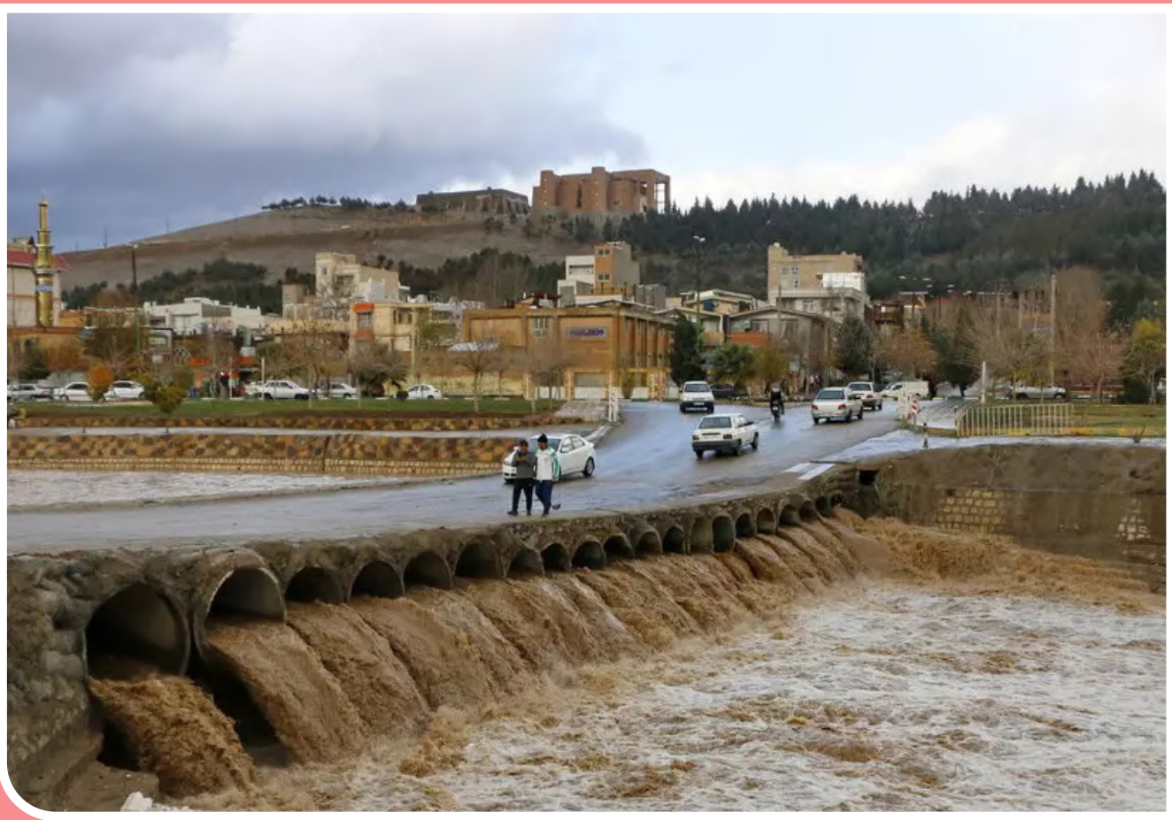
خروش «خرم رود» در خرم‌آباد