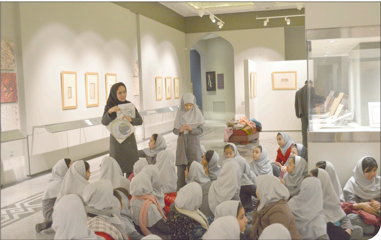
دریافتی از موسسه کانیگانه و موزه ملی سنگ

گزارشی درباره نقش موزه‌ها در پرورش نسلی که قرار است حافظ میراث‌فرهنگی باشند