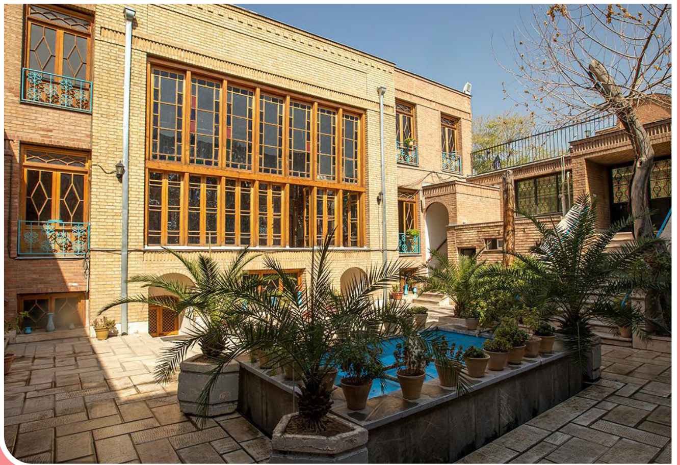
خانه بازار یا همان عمارت سلطان بیگم