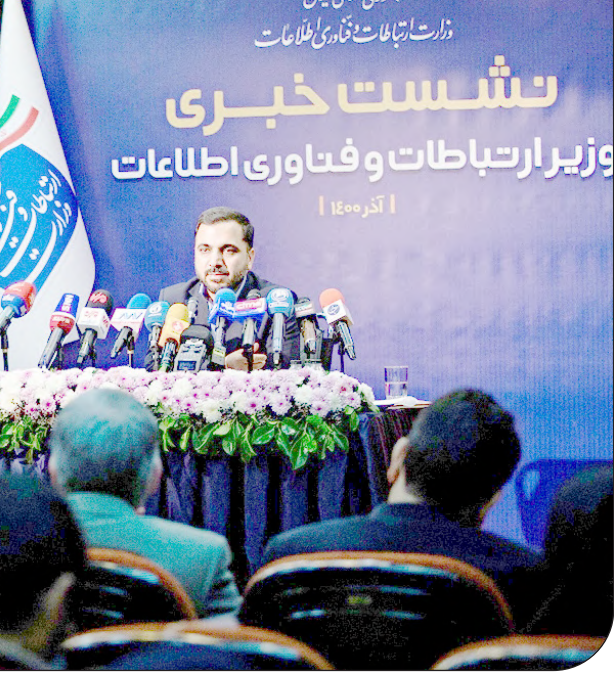
— باشگاه خبرنگاران —

روابط‌عمومی شورای نگهبان توضیحاتی درباره بودجه پیشنهادی این شورا برای سال ۱۴۰۱ منتشر کرد. در اطلاعیه شورای نگهبان درباره افزایش ۲۳ درصدی بودجه این نهاد آمده است: «یکی از نهادهایی که بودجه پیشنهادی دولت در خصوص آن مورد تحلیل و ارزیابی برخی رسانه‌ها قرار گرفت شورای نگهبان بود تا جایی که تعدادی از رسانه‌ها افزایش بودجه این نهاد را شدید و تا ۳۳ درصد اعلام کردند. این در حالی است که تحلیل اعداد و ارقام بودجه پیشنهادی دولت حکایت از واقعیتی متفاوت دارد چرا که بودجه لایحه‌ای کاملا تخصصی بوده و کشف اعداد و ارقام مرتبط با دستگاه‌ها و نهادهای حاکمیتی در بودجه نیازمند توجه دقیق به همه متون و اسناد مرتبط با لایحه بودجه همانند ماده واحده و تبصره‌ها، جدول و پیوست‌ها است. با رویکرد کارشناسانه به لایحه پیشنهادی بودجه ۱۴۰۱ می‌توان گفت که مجموع بودجه پیشنهادی برای شورای نگهبان در سال ۱۴۰۱، ۲۷۷ میلیارد تومان است که ناظر بر وظایف و فعالیت‌های مستمر و دائمی اعم از هزینه‌ای، عمرانی و پژوهشی شورای نگهبان در نظر گرفته شده است.»