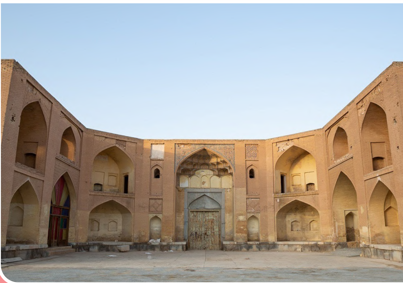
کاروانسرای تاریخی مهیار اصفهان-عکس از صادق بصیرت/ باشگاه خبرنگاران جوان