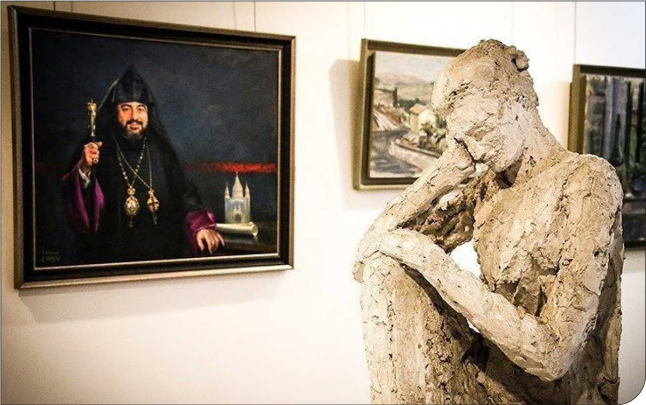
| اقتصاد آنلاین |

به نقل از سایت یونسکو، شانزدهمین جلسه کمیته بین دولتی حفاظت از میراث فرهنگی ناملموس از ۱۳ تا ۱۸ دسامبر ۲۰۲۱ (۲۲ تا ۲۷ آذر) به‌صورت آنلاین برگزار می‌شود.