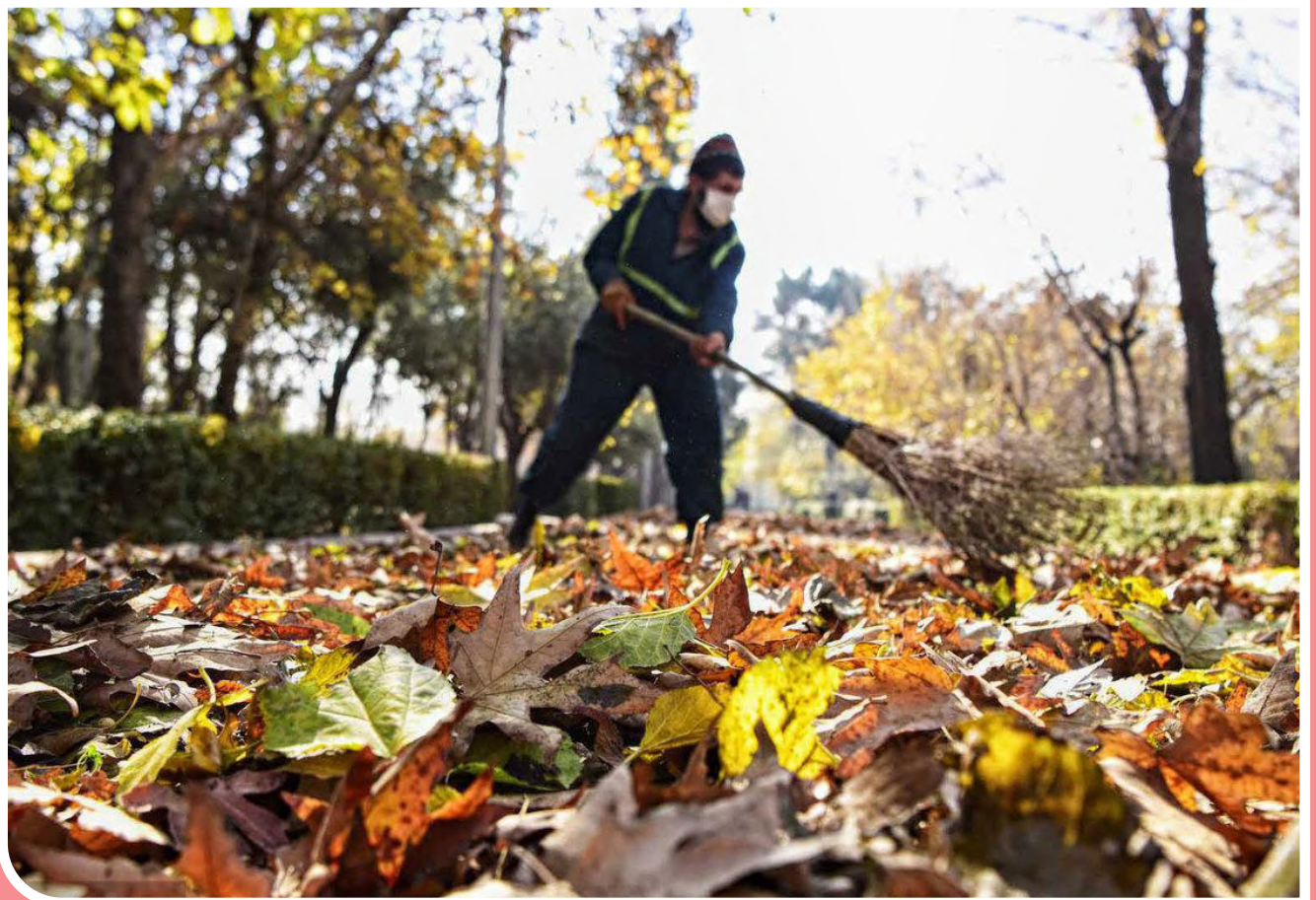
گذرگاه‌های پاییزی پایتخت