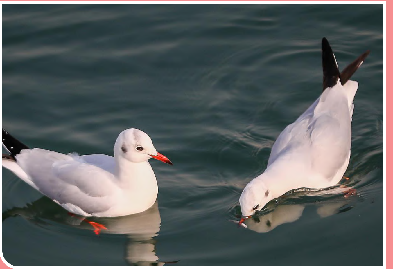
پرندگان مهاجر دریاچه چیتگر