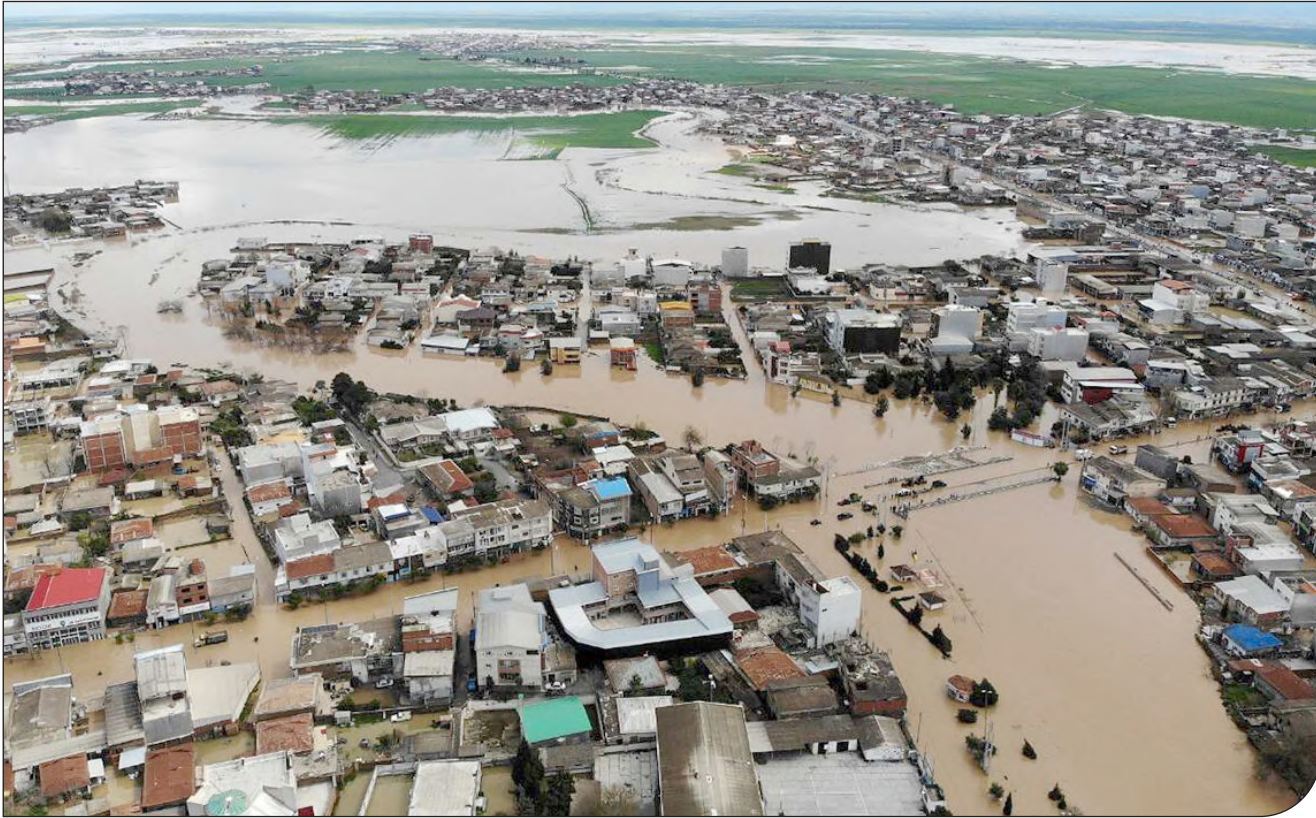
— ۳۳۹ —

در ایران این صندوق به تازگی تشکیل شده و هنوز ذخیره کافی ندارد