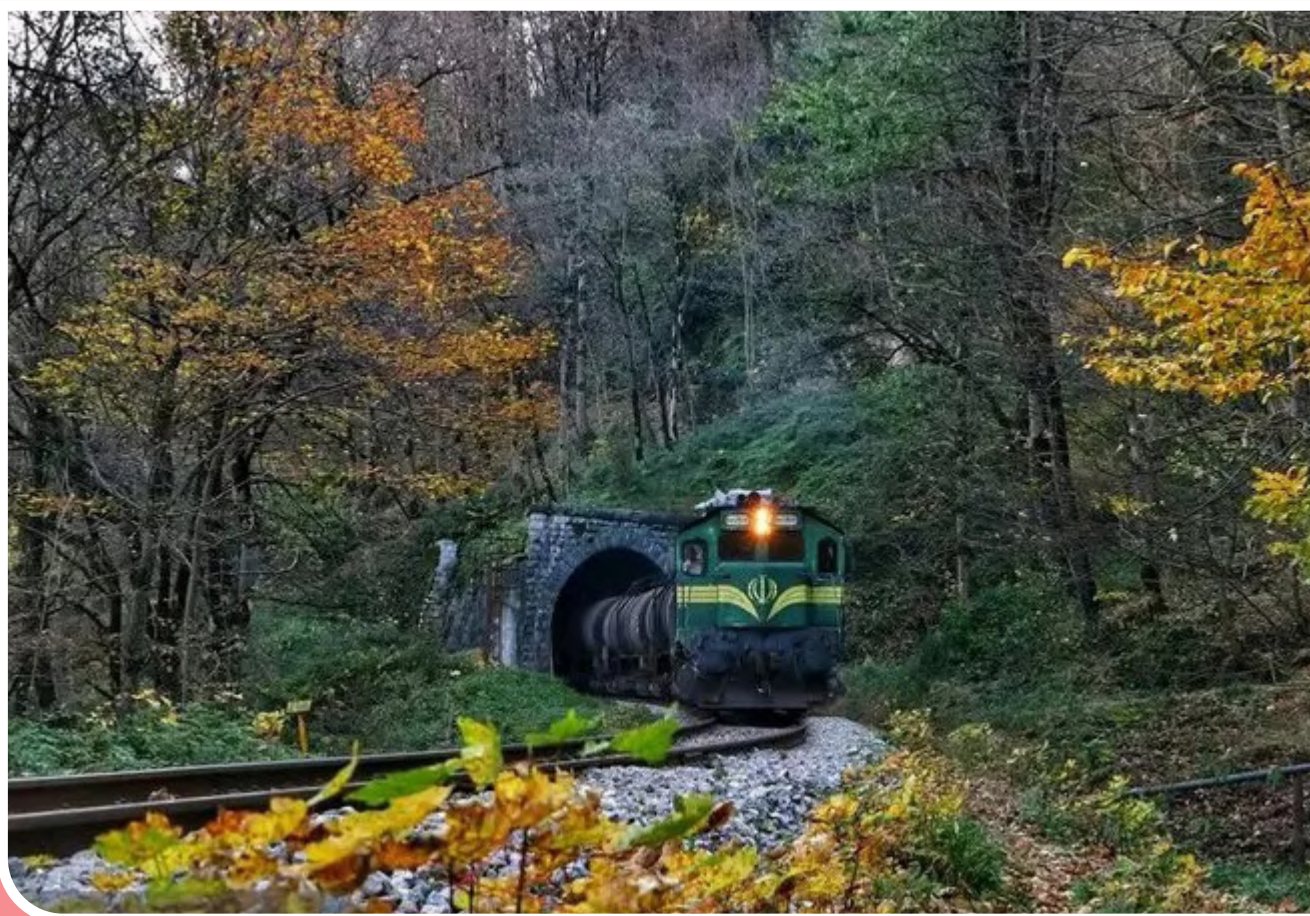
طبیعت پاییزی راه آهن شمال در شیرگاه