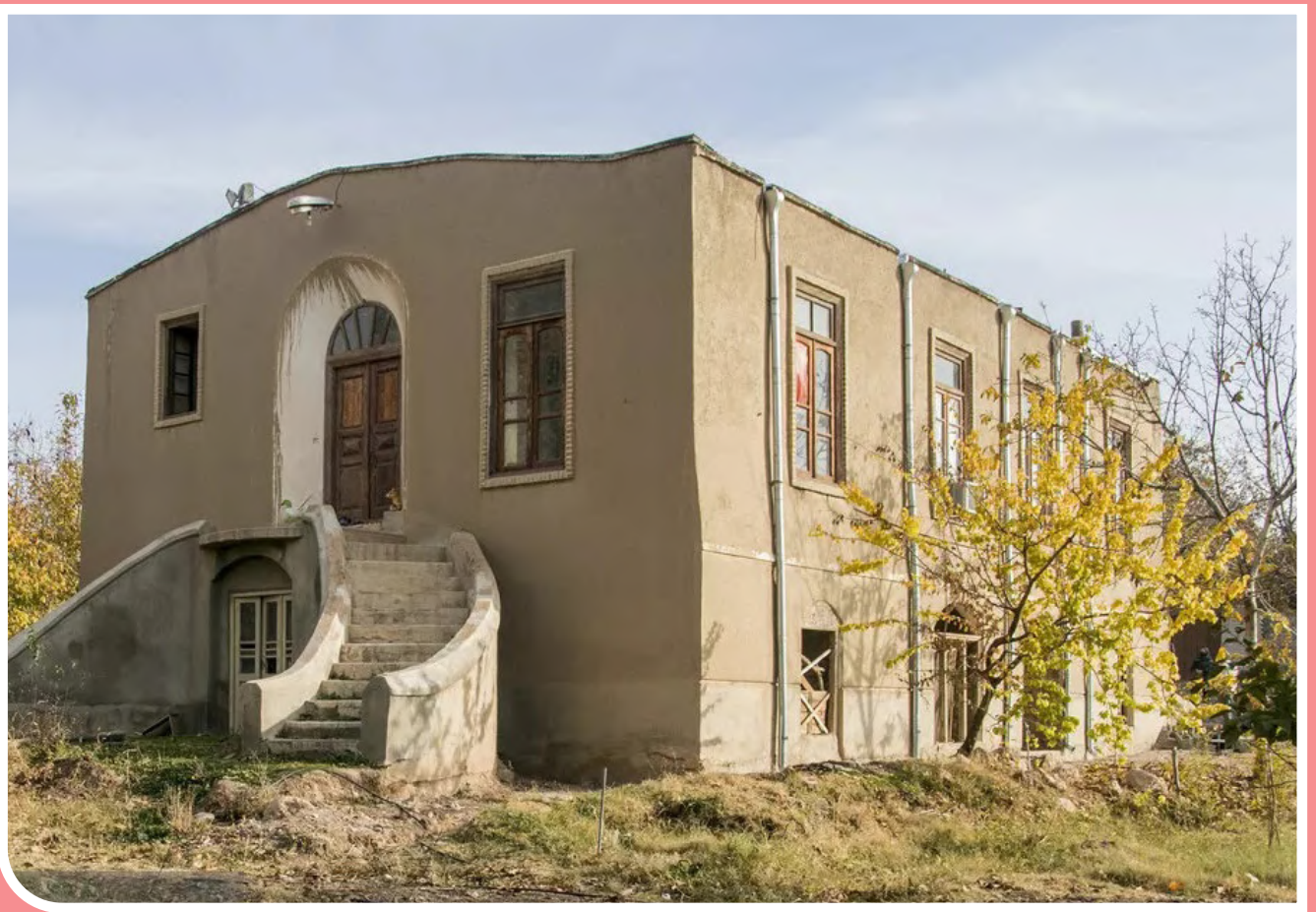
شهر تاریخی «تسوج» میان دو استان آذربایجان شرقی و غربی