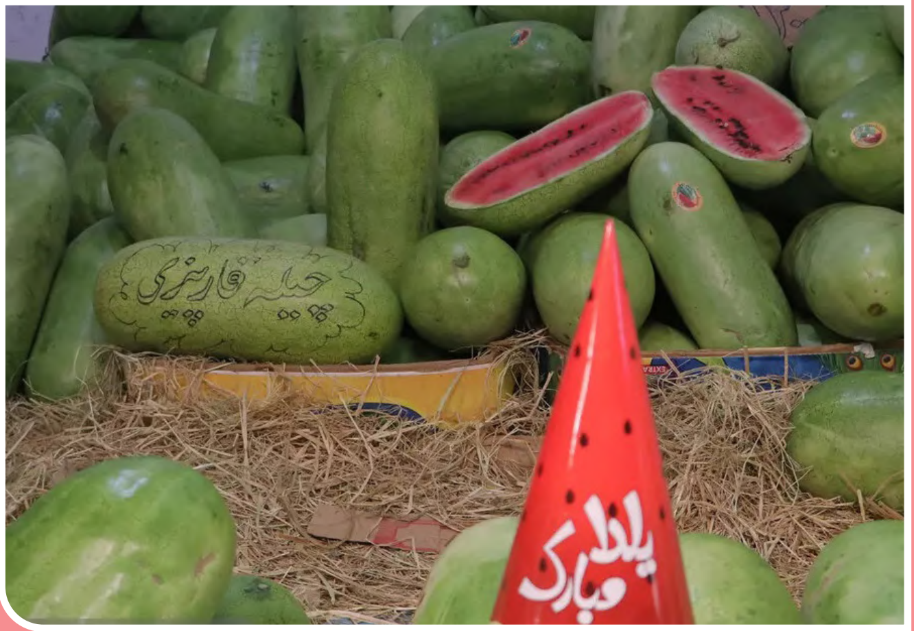
خرید آخرین شب پلدان قرن