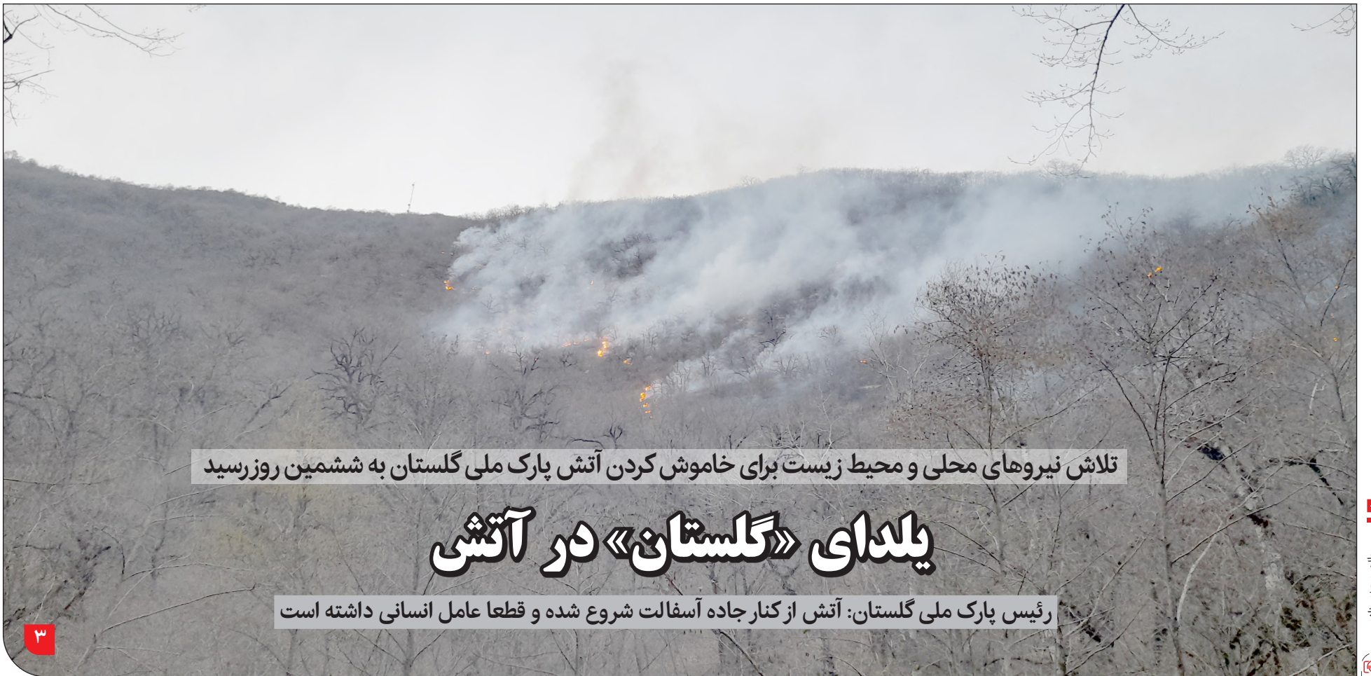
تلاش نیروهای محلی و محیط زیست برای خاموش کردن آتش پارک ملی گلستان به ششمین روز رسید