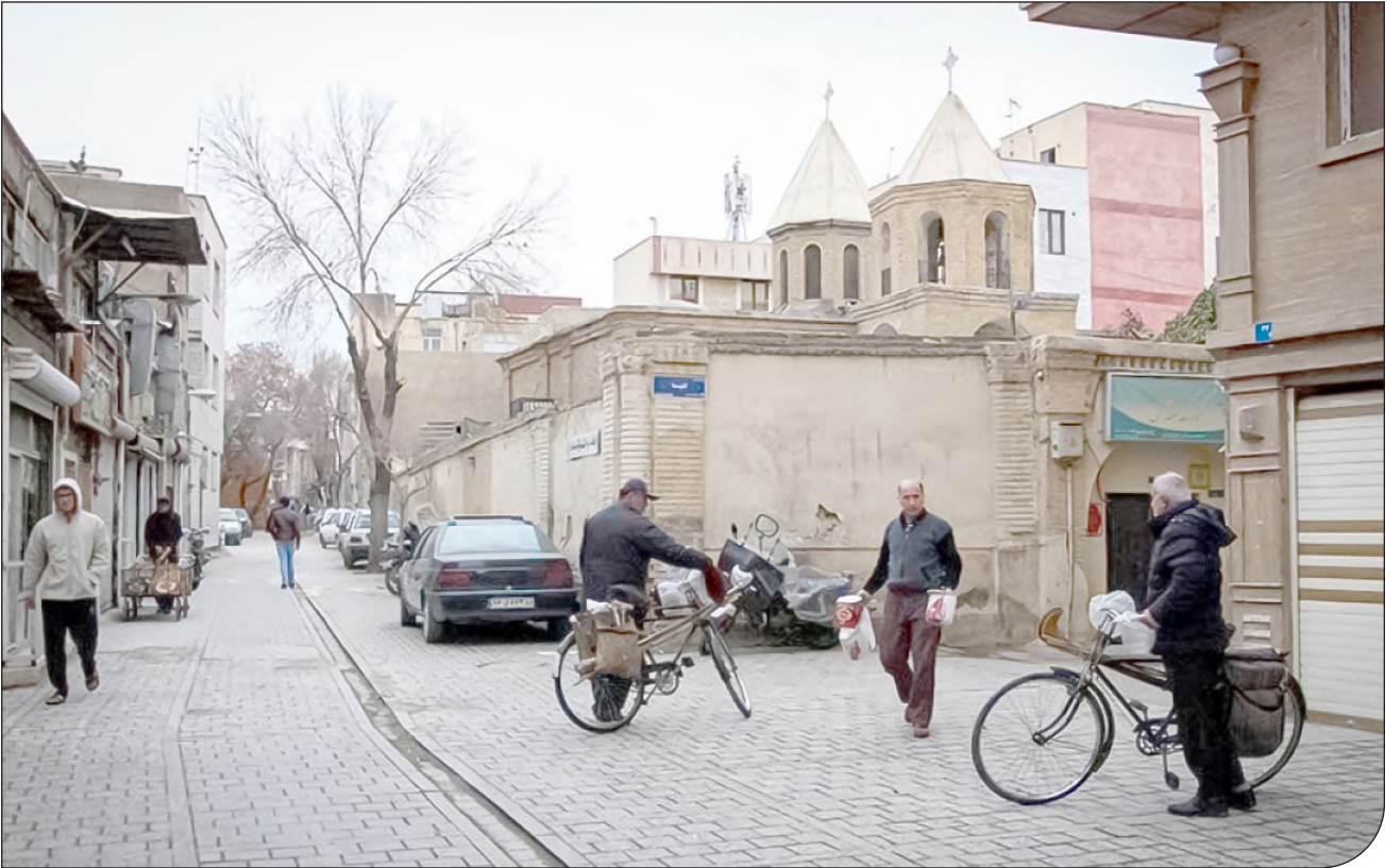
| تیرا | [۱]