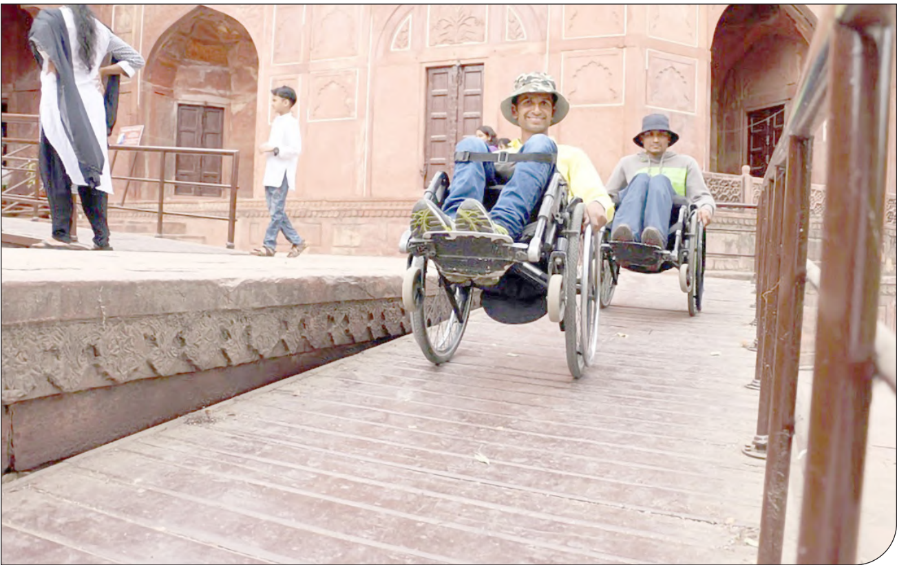
گزارش «پیام ما» از جاذبه‌های گردشگری جهان که برای معلولان دسترس پذیر شدند