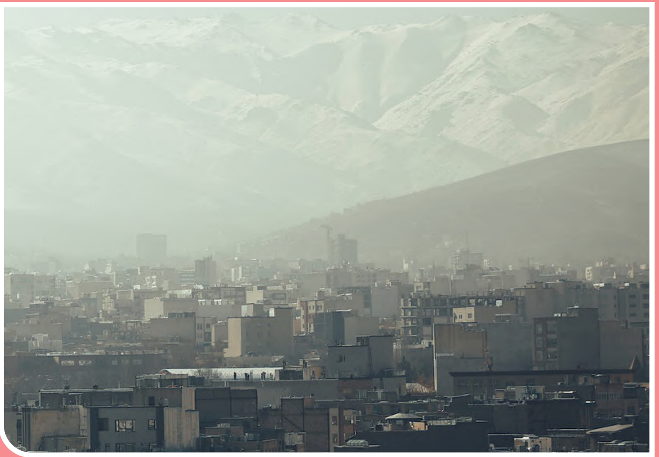
آلودگی هوای همدان