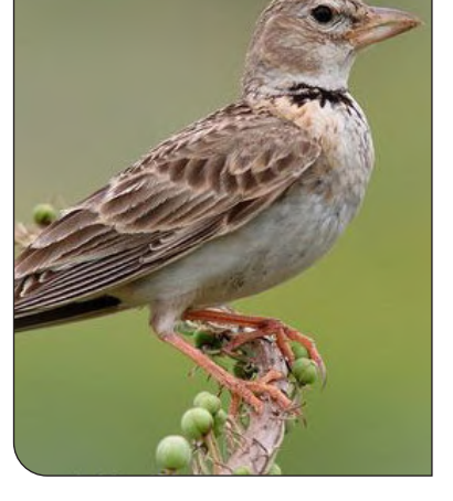
این پرنده، ۱۶ سانتی‌متر طول دارد و شبیه طوقه چکاوک، اما اندکی کوچک‌تر است و در پرواز، زیربال‌ها خاکستری قهوه‌ای، بدون حاشیه سفید انتهای شاه‌پرهای ثانویه، دیده می‌شود. انتهای دم سفید و پرهای بیرونی نخودی قهوه‌ای رنگ است.