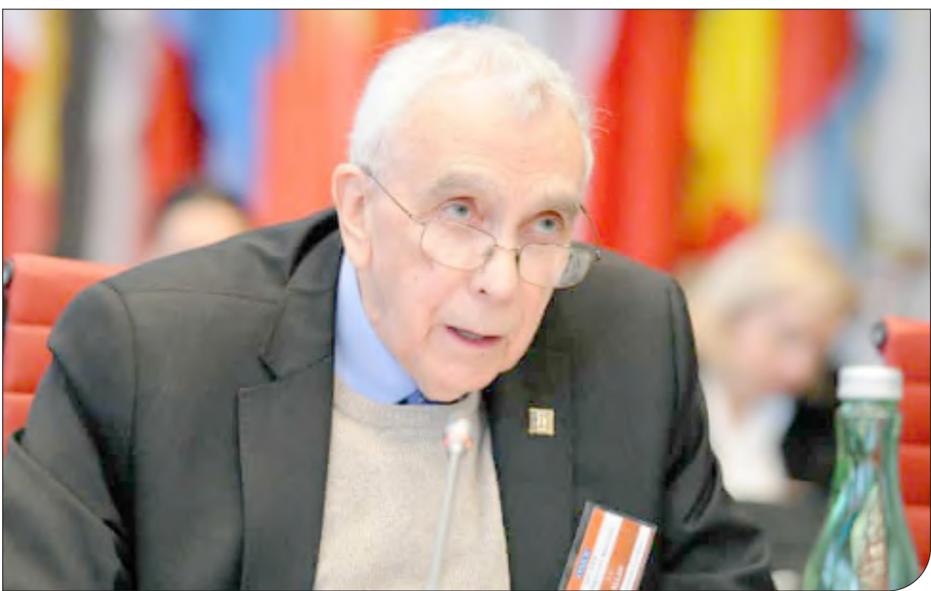
| Theguardian |