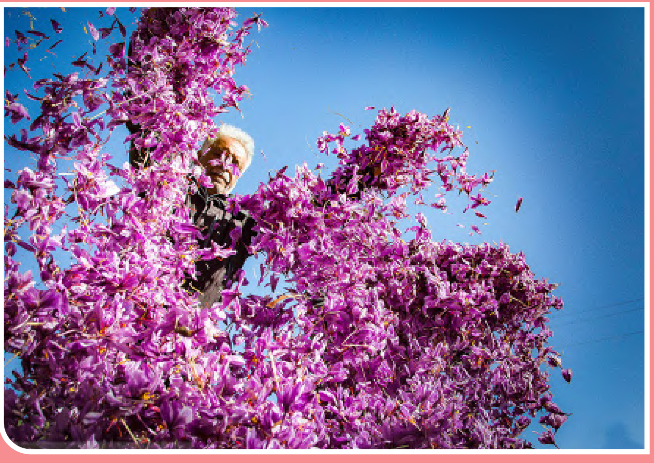
زعفران «طلای سرخ» خراسان