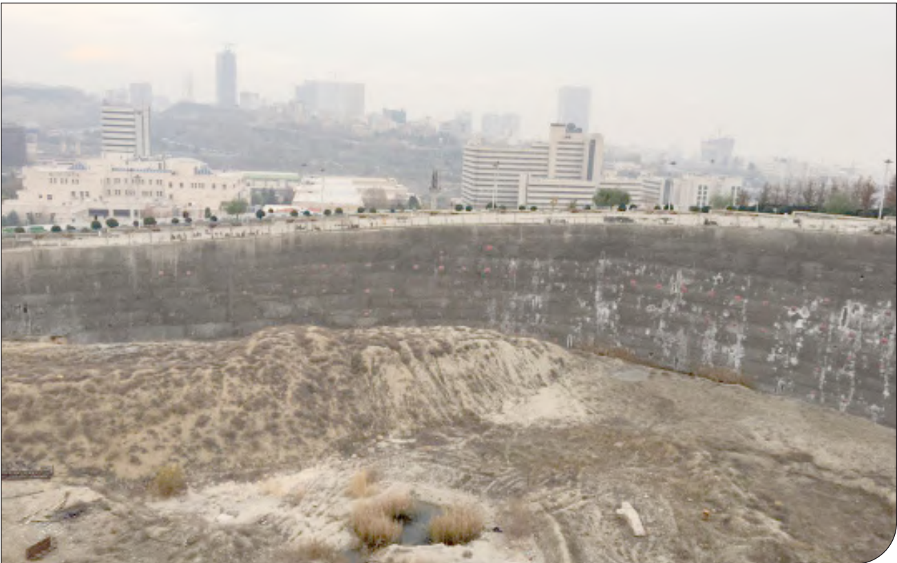
پیام‌ها | قانون موشی |

دختر ۱۳ ساله‌ای که از دست مادرش رها شده و داخل نهر آب افتاده بود نجات یافت. به گزارش روزنامه پیام، پس از بارش شدید باران دیشب و بالا آمدن آب نهرهای معابر شهر تهران، دختر ۱۳ ساله‌ای در اثر بی‌احتیاطی و رها کردن دست مادرش داخل نهر آب افتاد پس از سقوط دختر به نهر آب این دختر در حالی‌که آب حدود ۴۰۰ متر او را با خود در مسیر نهر کشیده بود با حضور به موقع نیروهای شهرداری ناحیه یک منطقه ۳ و عوامل آتش‌نشانی نجات داده شد. سایت روابطعمومی شهرداری تهران در این رابطه نوشته است: در این حادثه که در خیابان شیخ بهایی منطقه ۳ رخ داد این دختر از ناحیه پا و سر دچار آسیب دیدگی جزئی شد و نیروهای آتش‌نشانی در حال گفتار درمانی به این دختر هستند تا در صورت نیاز او را راهی بیمارستان کنند.