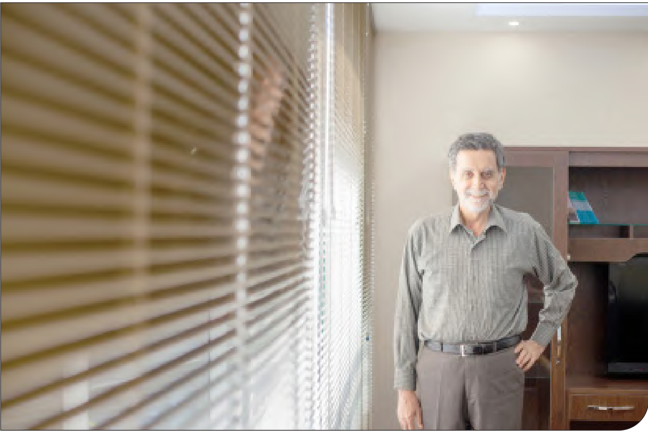
رئیس هیئت مدیره آب تهران

به جای مدیریت دولت محور در زمینه آب، بهتر است مدیریت جامعه‌محور داشته باشیم