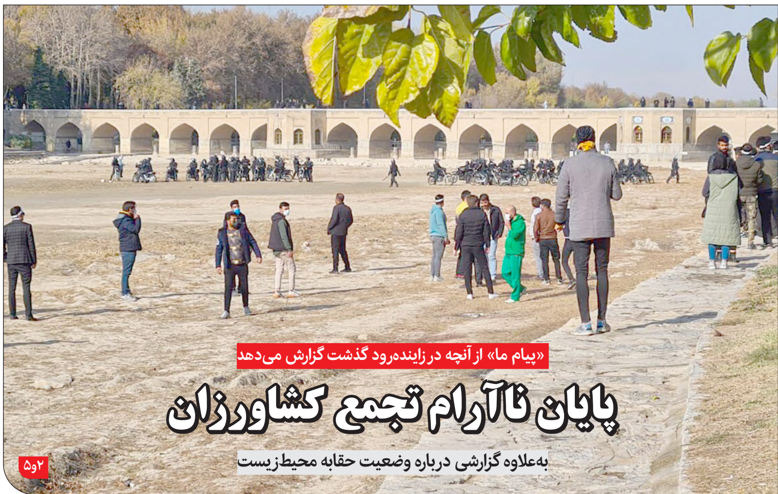
«پیام ما» از آنچه در زاینده‌رود گذشت گزارش می‌دهد

مدیر امور آب منطقه‌ای شرق خوزستان: در بسیاری از شهرهای خوزستان آبراهه‌هایی بوده‌اند که به مرور زمان در آنها ساخت و ساز شده است