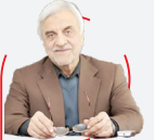
سید مصطفی هاشمی‌طبا