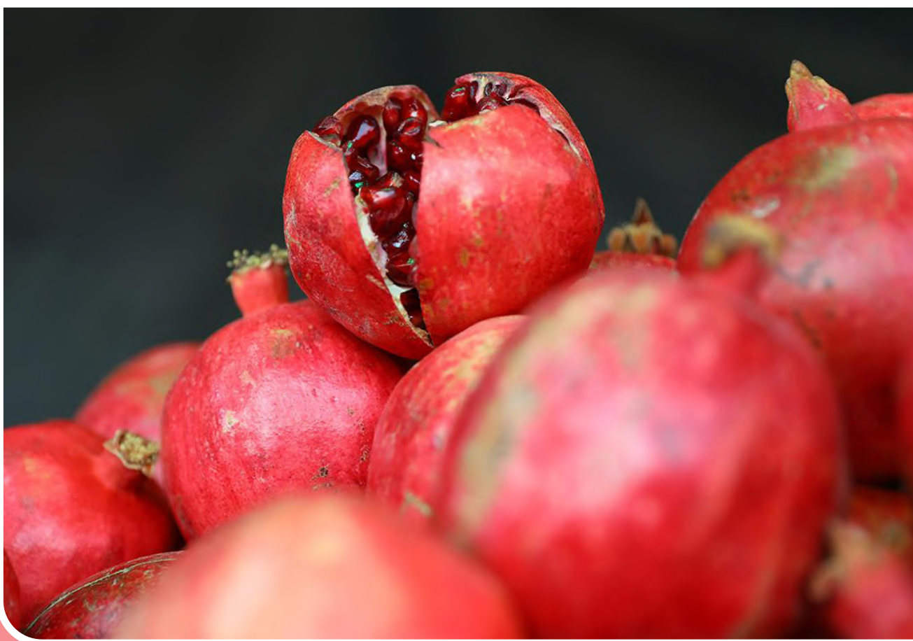
جشنواره انار «صد دانه یاقوت» در فرهنگسرای اشراق