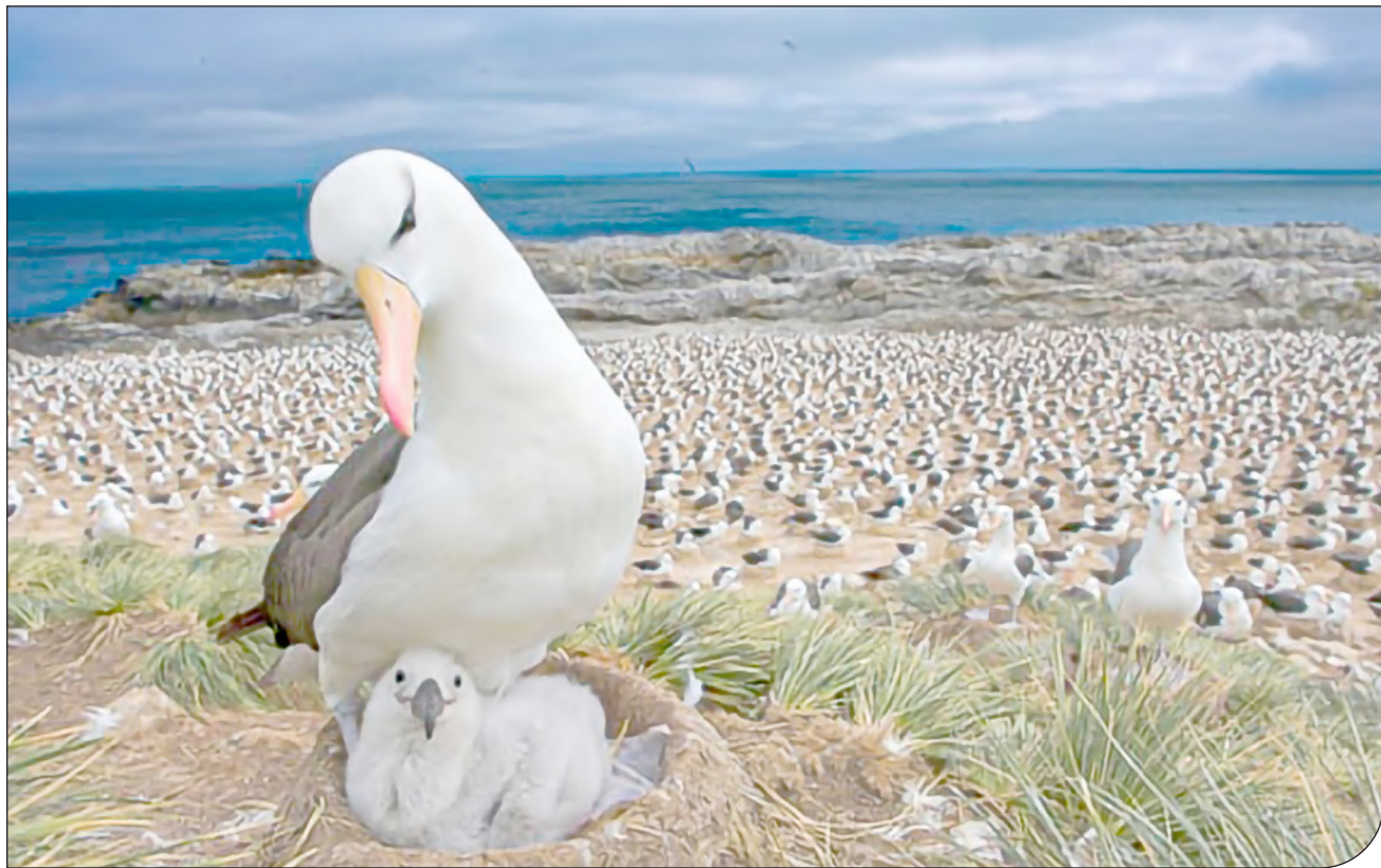
— ۵۰ — [۵]

تحقیقات جدید نشان می‌دهند که گرم شدن آب‌ها باعث افزایش طلاق میان گونه‌ای از پرندگان دریایی شده است