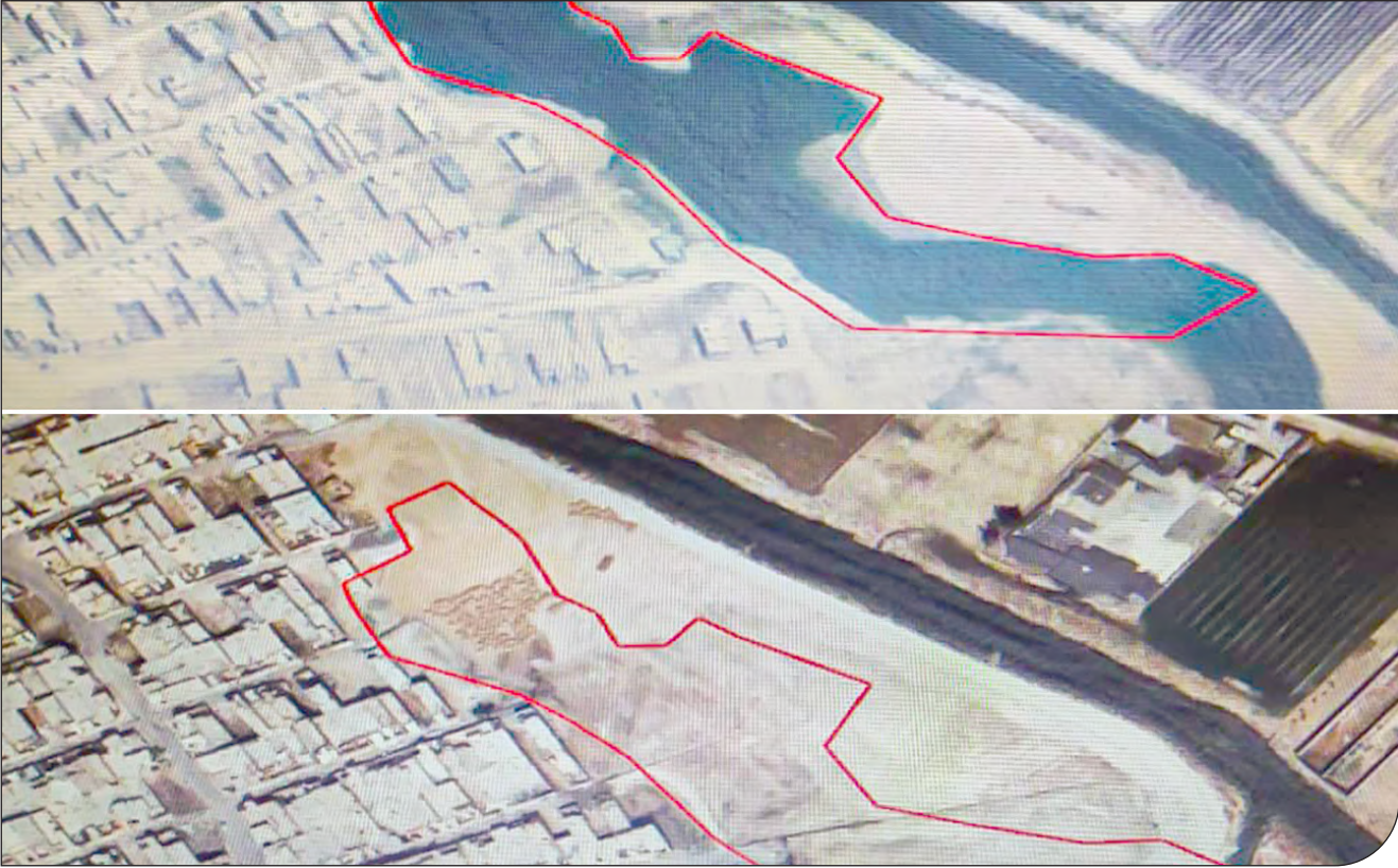
— ۱ —