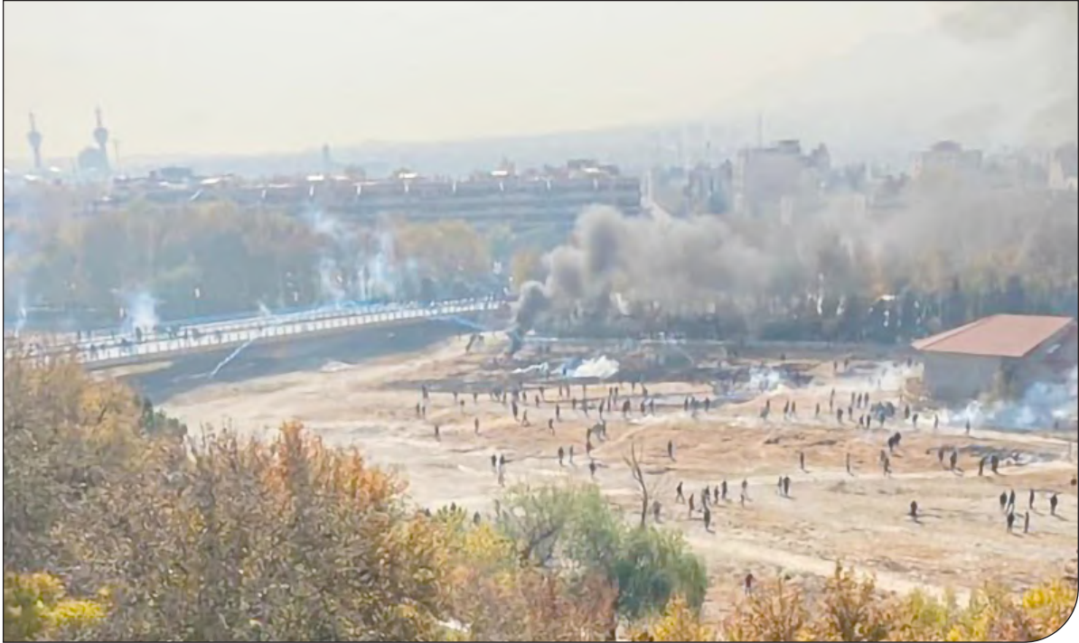
— 1 — تاریخ: ۱۳۹۸ —

سال شانزدهم | شماره پیاپی ۱۶۳ | شنبه ۶ آذر ۱۴۰۰ |