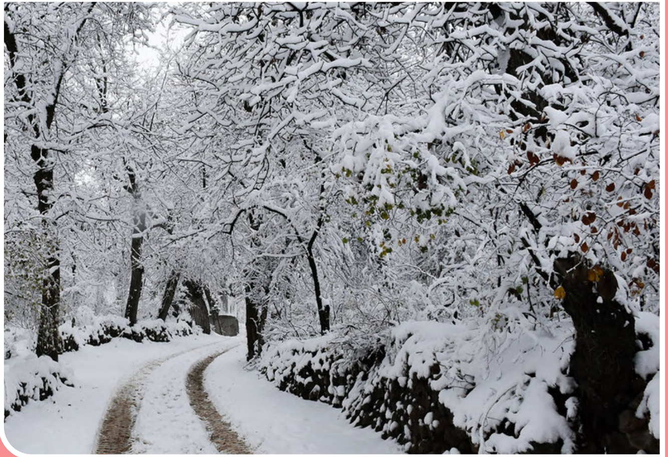
سفید پوش شدن « وفس » در پاییز / مهر