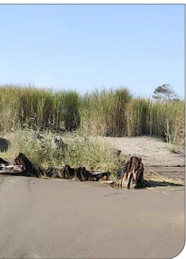
— ۱ —