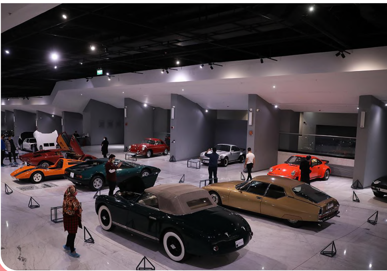
موزه خودروهای تاریخی ایران - عکس از شایان محرابی / آژانس عکس تهران

فیلم سینمایی «زلاوا» به کارگردانی ارسلان امیری در ادامه حضور جهانی خود در جشنواره سالانه منتقدین فیلم شیکاگو و سومین دوره جشنواره ژانر آنومالی - راجستر نیویورک به نمایش درمی‌آید. به گزارش مهر، انجمن منتقدین فیلم شیکاگو به منظور بزرگداشت هنر سینما و نقد فیلم، هر ساله فیلم‌های برگزیده توسط گروه منتقدین خود را در قالب جشنواره‌ای از تاریخ ۲۱ تا ۲۳ آبان ماه در شیکاگو برگزار می‌کند. امسال سیزده فیلم در این رویداد حضور دارند و «زلاوا» در نیمه‌شب افتتاحیه جشنواره به نمایش درمی‌آید. همچنین سومین جشنواره آنومالی موسوم به «جشنواره فیلم‌های ژانر راجستر» که هر ساله در نیویورک برگزار می‌شود، فیلم «زلاوا» به تهیه‌کنندگی سمیرا و روح‌الله برادری را در بخش رسمی خود انتخاب کرده است. این جشنواره با رویکرد معرفی سینمای مستقل ژانر در تمامی گونه‌های وحشت، فانتزی، علمی-تخیلی و اکشن، آثاری را از کشورهای مختلف از تاریخ ۱۳ تا ۱۶ آبان‌ماه به نمایش درمی‌آورد.