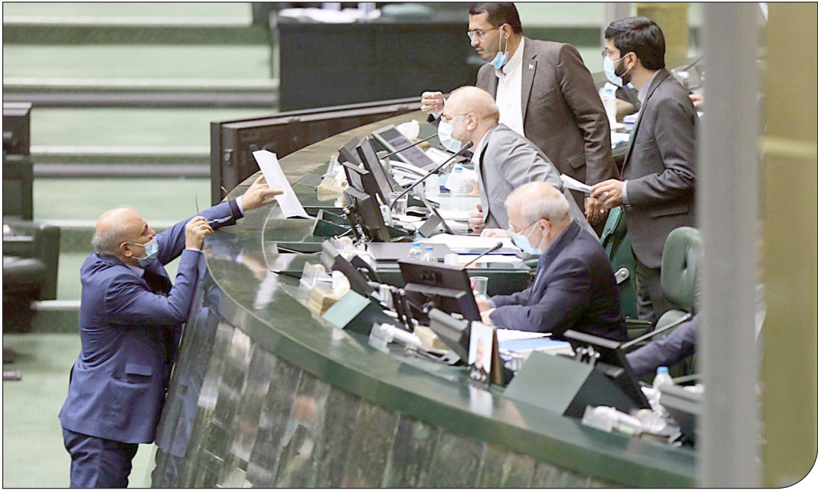
- تصویر -

دولت و مجلس بر سر مقابله با انحراف بودجه‌نویسی بر مبنای رفاقت توافق دارند