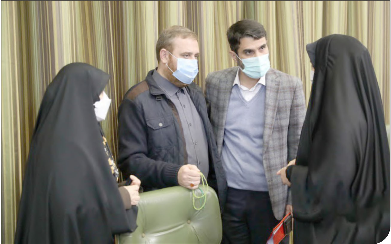
شورای شهر | ۱۳۹۱