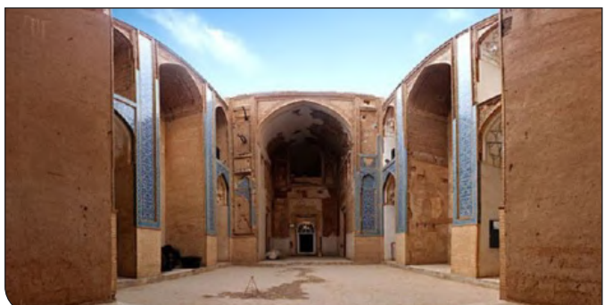
اسیری در ایران

(سال ۷۳۲) به ایجاد این مدرسه راضی شد. لذا طرح مدرسه را از تبریز به یزد فرستاد. پس به طور طبع طرح بر روی کاغذ بوده است. این است عبارت کتاب مذکور: «در یک روز سی‌وسه بقعه طرح انداخته از بنیاد و مساجد و خانقاه و رباطات و حمامات و مصانع و در تبریز طرح مدرسه چهار منار و دارالسیادت و خانقاه و بازار و حمام بینداخت و به یزد فرستاد و بنایان عمارت بنا کردند. بنای موجود شامل صحنی مربع شکل و دو ایوان رفیع در دو سوی جنوب غربی و شمال شرقی آن و گنبدخانه