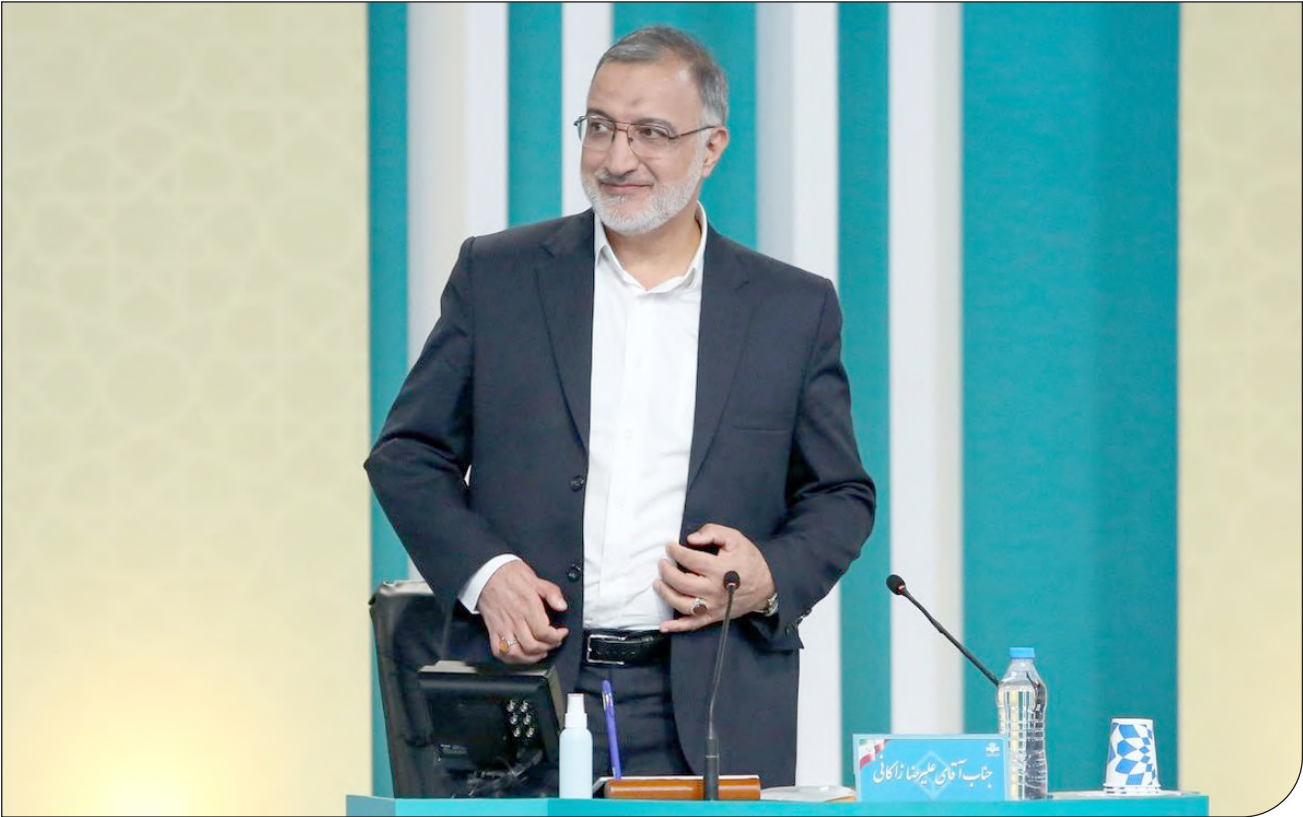
باشگاه خبرنگاران جوان |

همچنین آبرسانی در قالب تانکرهای سیار در محله های که دچار قطعی آب شدند درحال انجام است.