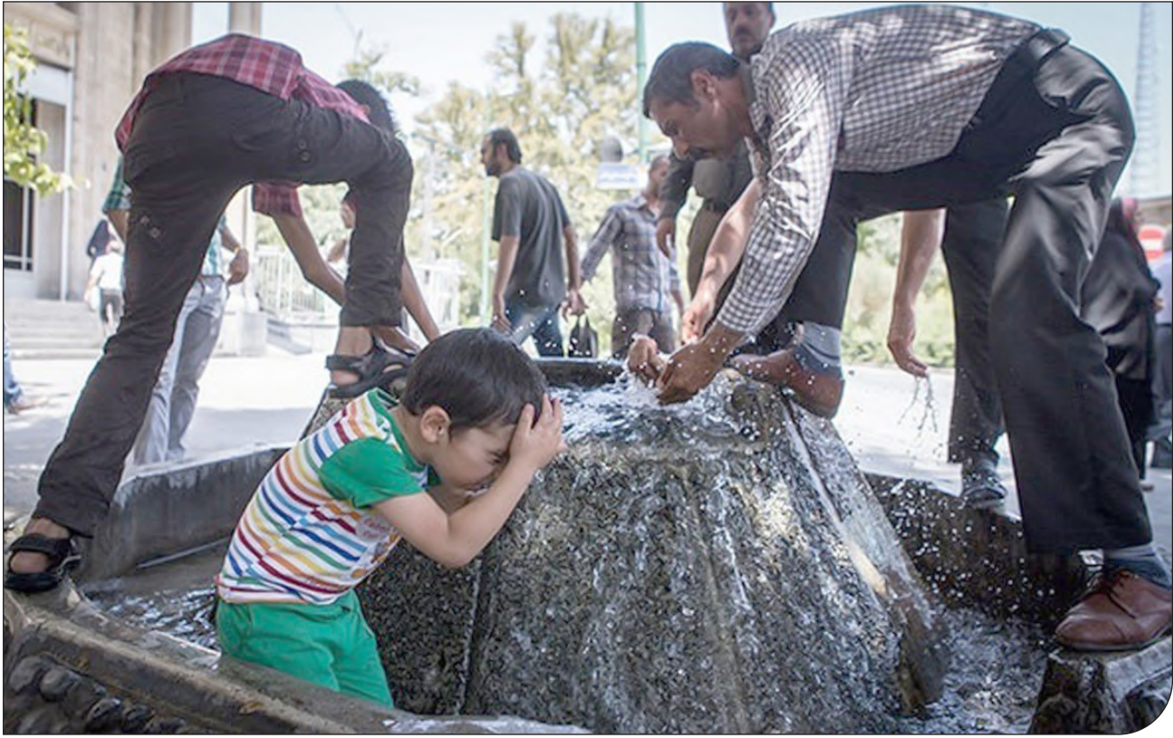
سازمان فضایی ایران دمای سطح زمین در شش ماهه اول سال را محاسبه کرد

سخنگوی سازمان مدیریت بحران کشور با بیان اینکه این سازمان طی نامه‌ای مکتوب نیز این موارد را به مسئولان مرتبط در این دو استان و سازمان‌ها و دستگاه‌های امدادی اعلام کرده است، گفت: توصیه سازمان مدیریت بحران این است که طی این دو روز تردد و توقف در حاشیه مسیرها و رودخانه‌ها ممنوع صورت گرفته و در تردهای جاده‌ای احتیاط لازم انجام شود. بازگشایی و دهانه پل‌ها و آبروها، استحکام بخشی به سازه‌های موقت و وضعیت نظیر گلخانه‌ها تابلوهای تبلیغاتی و ... نیز از دیگر توصیه‌های سازمان مدیریت بحران بوده است. او اضافه کرد: همچنین تمامی دستگاه‌های امدادی و خدماتی و انتظامی برای مداخله به موقع در امداد رسانی و پیشگیری از هرگونه حادثه احتمالی به حالت آمادگی باش درآمده‌اند و تأکید شده است تا اطلاع رسانی و هشدار به موقع از طریق رسانه‌های محلی، رعایت نکات ایمنی هنگام تردد در مناطق در معرض خطر و ... انجام شود.