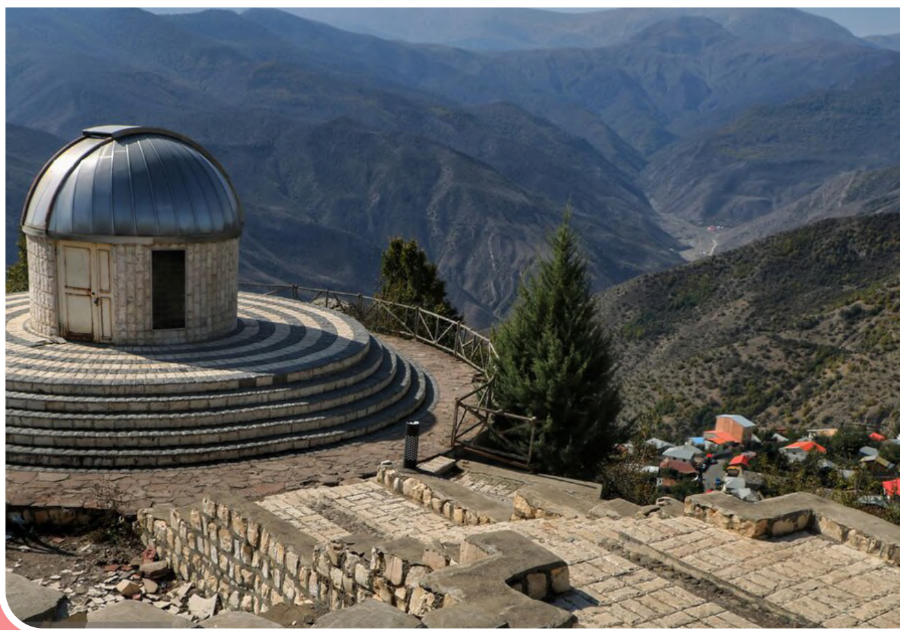
نخستین رصدخانه آماتوری استان مازندران