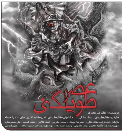
نویسنده: غفررضا غفاری طرح و کارگردان: عماد سالکی مطابق با کارگردان: امیرکاوه آهنین‌جان، نادیا حسام کارگردان: امیرکاوه آهنین‌جان، نادیا حسام طراح: امیرکاوه آهنین‌جان، نادیا حسام مدیر آکادمی: امیرکاوه آهنین‌جان، نادیا حسام مدیر تئاتر: امیرکاوه آهنین‌جان، نادیا حسام

سینماهای سراسر کشور روزهای شنبه و پنجشنبه برابر با ۱۳ و ۱۵ مهرماه همزمان با وفات پیامبر اسلام (ص) و شهادت امام حسن مجتبی (ع) و امام رضا (ع) به طور کامل تعطیل هستند. روز دوشنبه و چهارشنبه نیز فیلم‌های کمدی تنها تا ساعت ۱۸ اجازه اکران دارند اما «درخت گردو» ساخته محمدرحیم مهدویان و فیلم‌های اجتماعی دیگر تا آخرین سینماها می‌توانند اکران داشته باشند. سینماهای سراسر کشور از روز جمعه ۱۶ مهرماه به روال معمول فعالیت‌های خود را از سر می‌گیرند. در حال حاضر فیلم سینمایی «دینامیت» ساخته مسعود اطیابی با فروش ۱۳ میلیارد و ۷۰۰ میلیون تومان، «درخت گردو» ساخته محمدرحیم مهدویان با فروش یک میلیارد و ۹۰۰ میلیون تومان و «تکتیرانداز» ساخته علی غفاری با فروش ۵۷ میلیون تومان سه فیلم اول جدول فروش هستند. / مهر