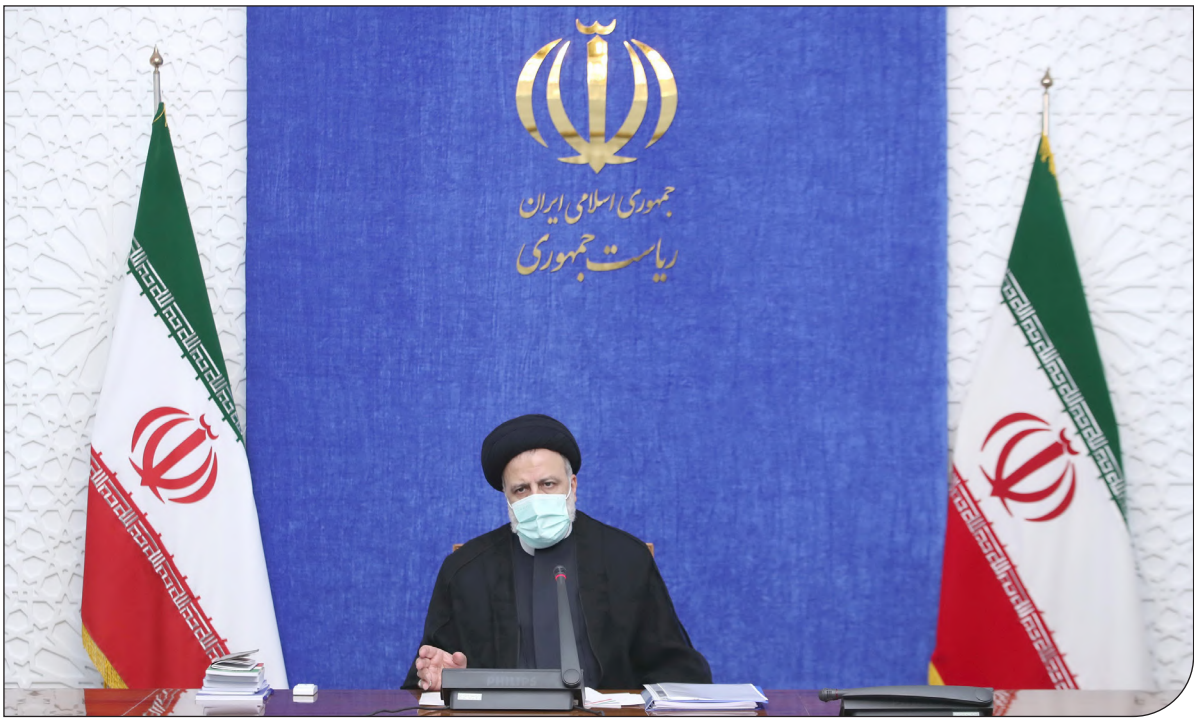
رئیس‌جمهور ایران، ع.رئیس‌جمهور ایران، ع.

شماره پیاپی ۲۰۹۲ | دوشنبه ۸ شهریور ۱۴۰۰ |