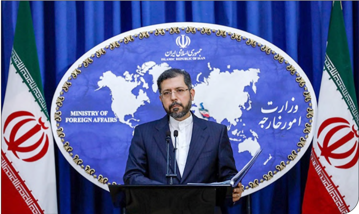
— تهران —

| سال شانزدهم | شماره پیاپی ۲۰۹۳ | سه‌شنبه ۹ شهریور ۱۴۰۰ |