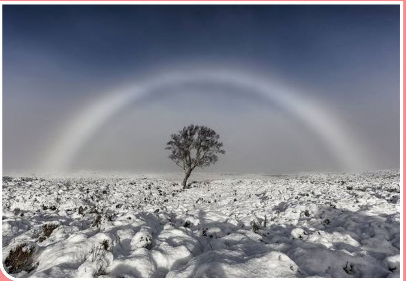
پدیده آب‌وهوایی قوس مه در اسکله‌ای در اسکاتلند