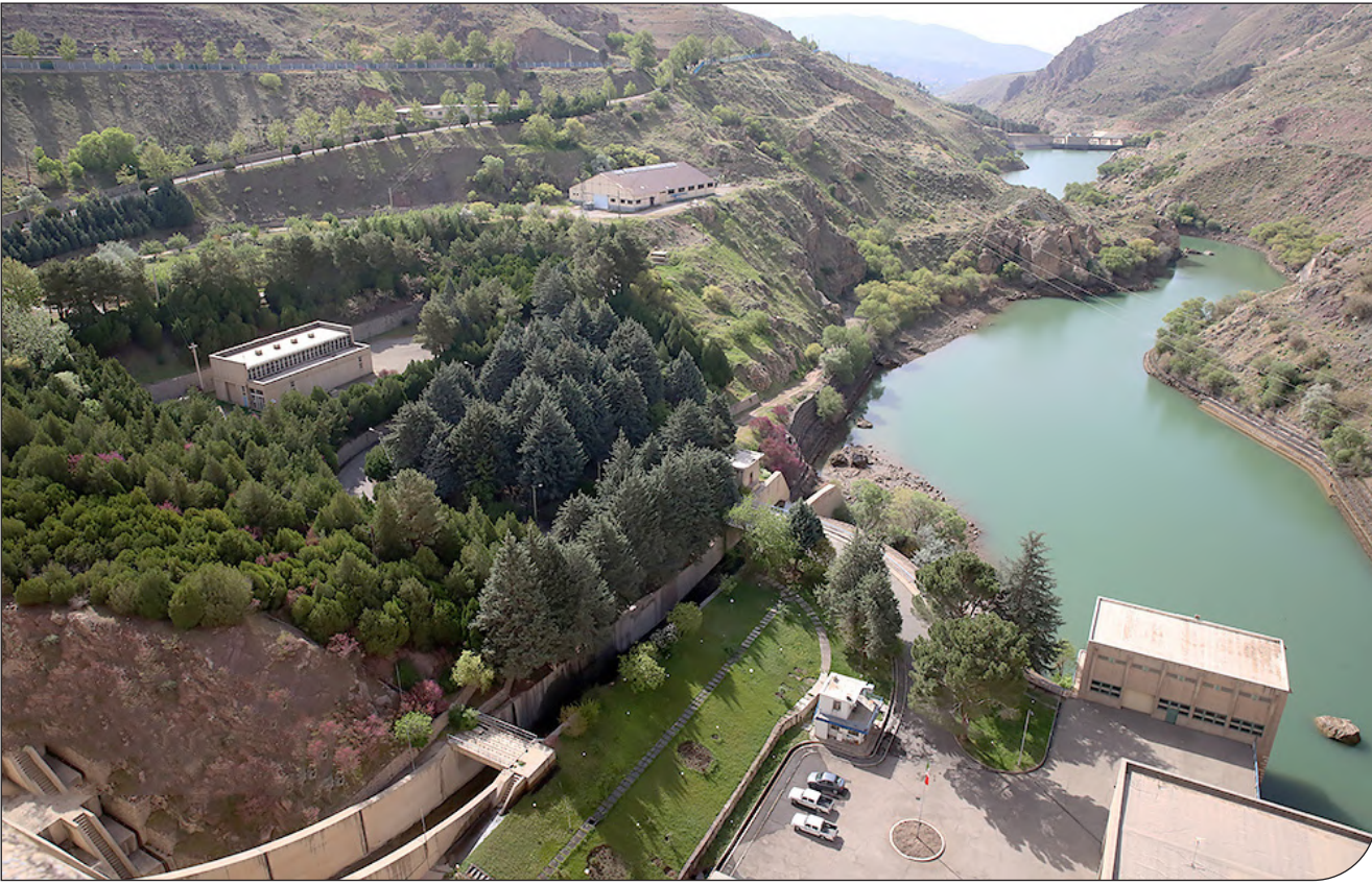
- مدیر دفتر بهره‌برداری و نگهداری از تاسیسات آبی و برق‌آبی شرکت آب منطقه‌ای تهران از وضعیت شکننده سدهای تهران خبر داد و

آب منطقه‌ای تهران: ورودی آب به مخازن سدهای تامین‌کننده آب شرب شهرهای تهران و کرج ۴۰ درصد کاهش داشته است