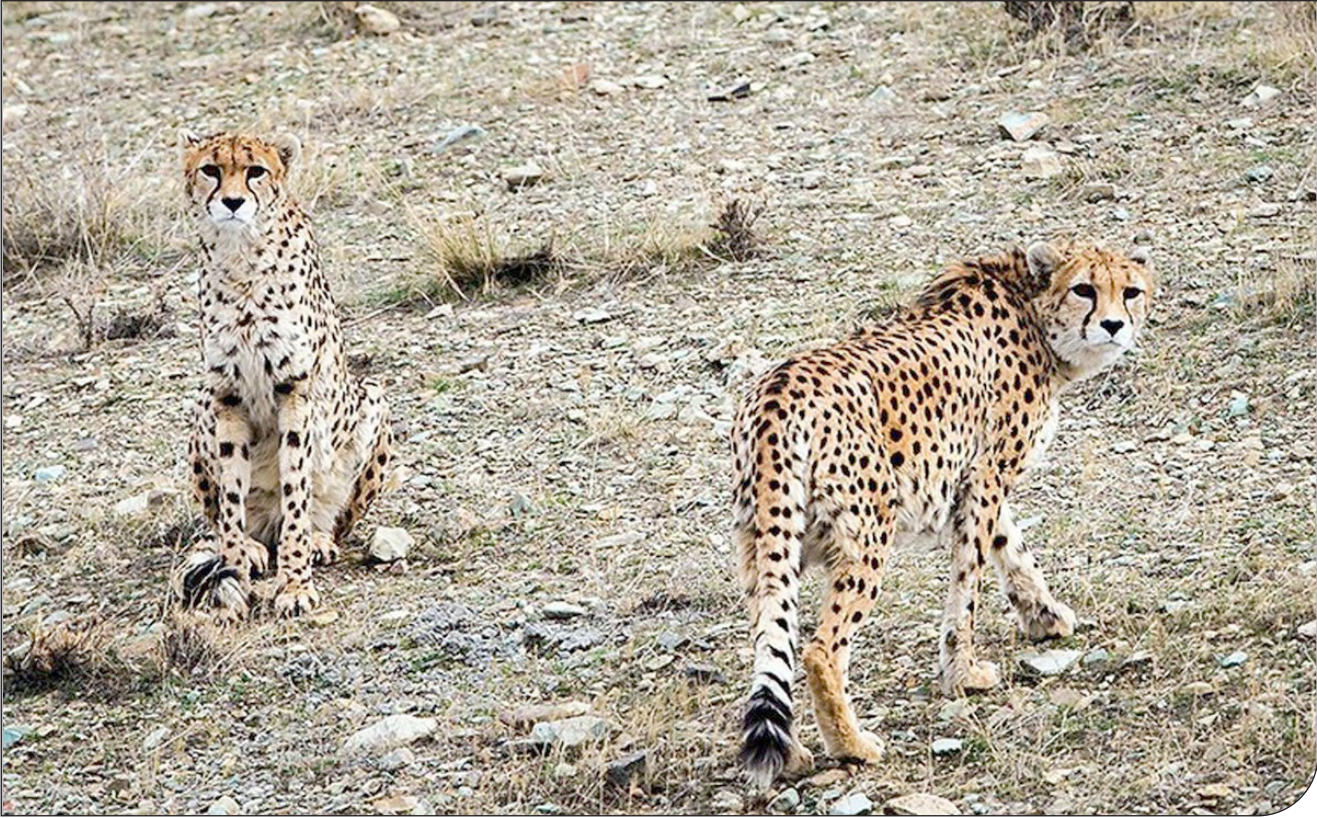
— ۳ —

با کاهش شدید جمعیت و از دست رفتن نسبت جنسی یوزها در زیستگاه‌های جنوبی چشم امید به زیستگاه‌های شمالی ایران دوخته شده است