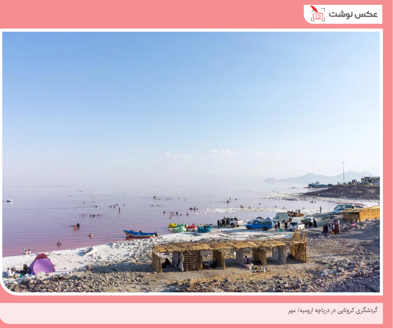
گردشگری کرناوی در دریاچه ارومیه / مهر

رمان «ترانزیت» نوشته آنا زکریس بتازگی با ترجمه ستاره نوتاج توسط انتشارات ققنوس با ۳۰۳ صفحه، شمارگان ۷۷۰ نسخه و قیمت ۵۸ هزار تومان منتشر و راهی بازار نشر شده است. این کتاب دویستونهمین کتاب ادبیات جهان و صدوهمفادوهمین رمانی است که این‌ناشر چاپ می‌کند. این‌رمان در ۱۰ فصل نوشته شده و در نسخه ترجمه فارسی آن، پس‌گفتاری به قلم هایپریش بل چاپ شده که مقاله‌ای است که سال ۱۹۶۴ در هفته‌نامه اشپینگل چاپ شده است. نتای رابلینگ نویسنده آلمانی این‌کتاب متولد سال ۱۹۰۰ در شهر ماینتس است که از سال ۱۹۲۸ اسم مستعار آنا زکریس را انتخاب کرد. نخستین کتابش با نام «مردگان در جزیره جال» سال ۱۹۲۴ منتشر شده بود و سال ۱۹۲۵ در پی ازدواج با لازلو رادوانی نویسنده مجارستانی به برلین نقل مکان کرد. / مهر