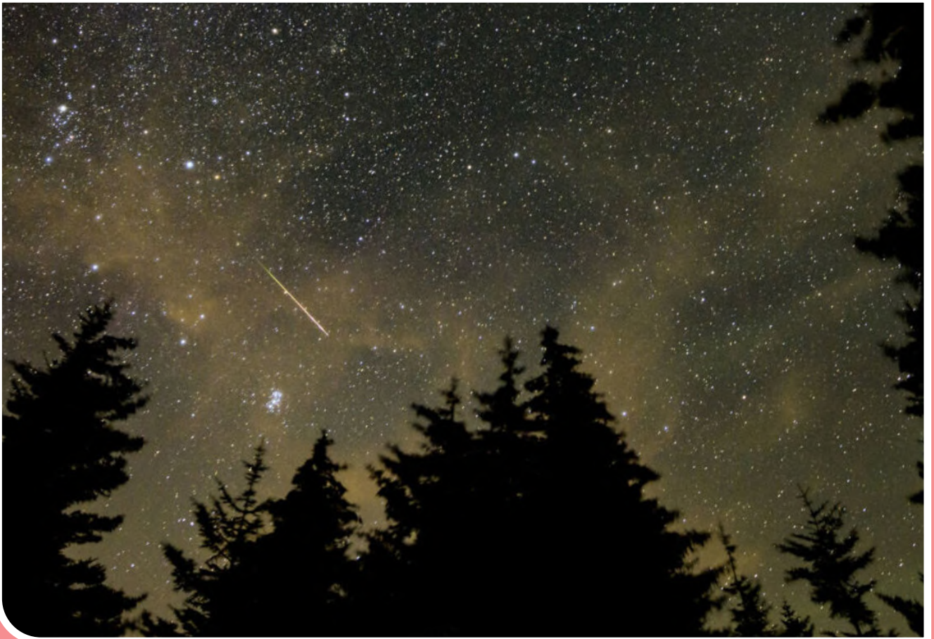
پارش شهابی زودرس برساوشی