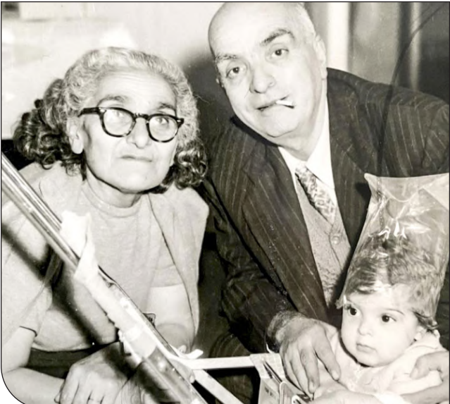
۱ ژرژ، ژرژ و پاریس