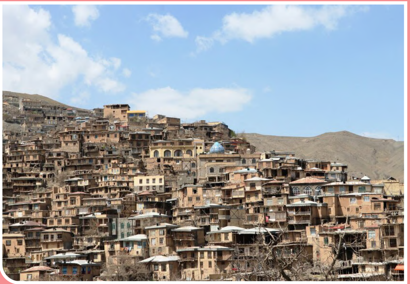
روستای تاریخی کنگ خراسان‌رضوی / مهر