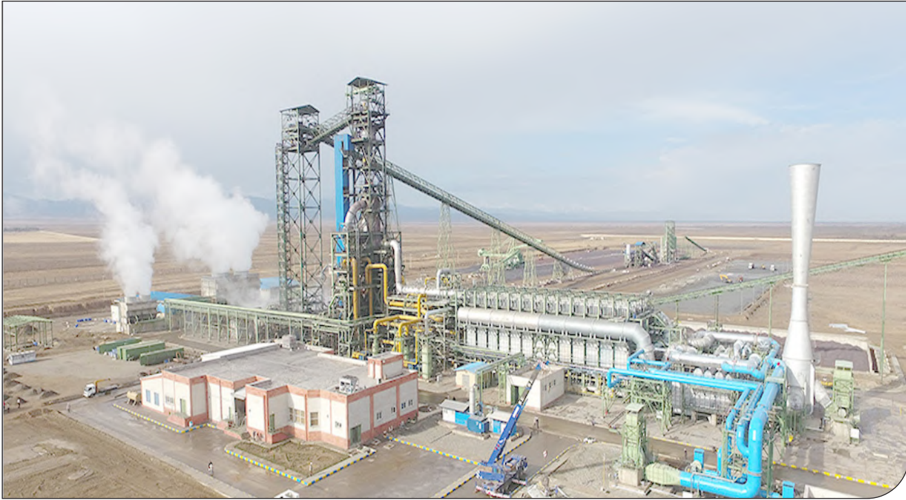
کارخانه فولاد سبزوار