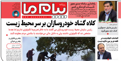
کلاه‌گشا خودروسازان بر سر محیط زیست

در روز ۱۲م مرداد ۱۳۹۹، تحریریه روزنامه سراسری «پیام‌ها» گزارشی با عنوان «خلا قانونی در برخورد با متخلفان حریق جنگل‌ها» کار کرده‌است، که به آتش‌سوزی بخشی از جنگل‌ها و مراتع منطقه «گاجال» بخش طرهران در استان لرستان و اراضی ملی مرتعی خاییز تنگستان در استان بوشهر اشاره دارد. همچنین خبری با مضمون «کلاه‌گشا خودروسازان بر سر محیط زیست» در این شماره از روزنامه به چاپ رسیده است.