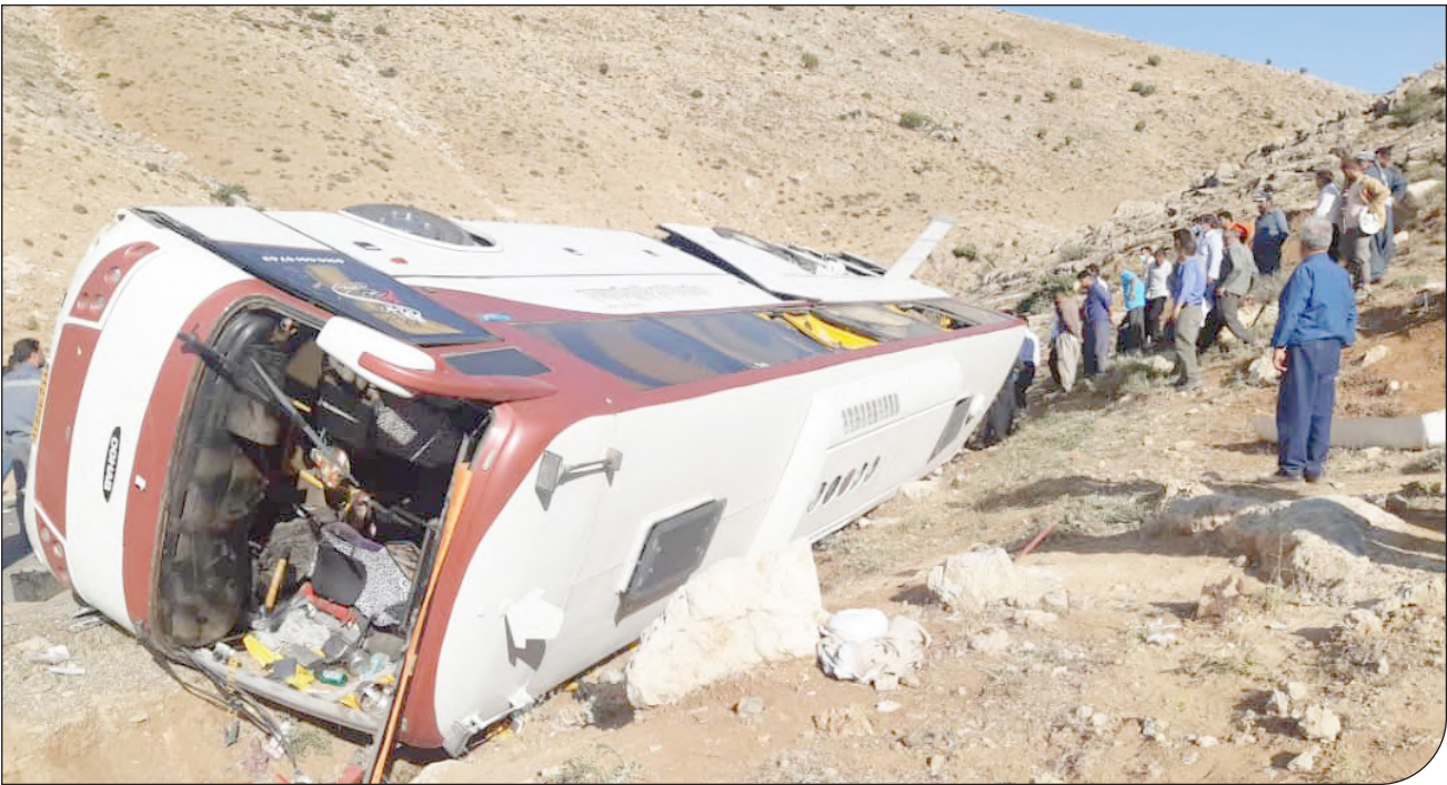
خبرگزاری صدا و سیما