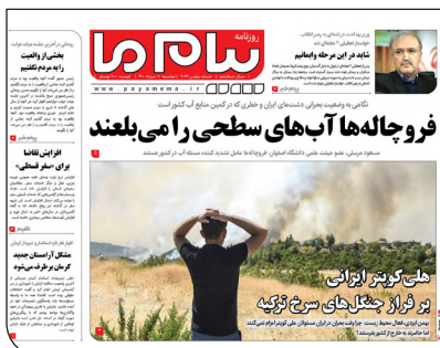
پیام ما امروز