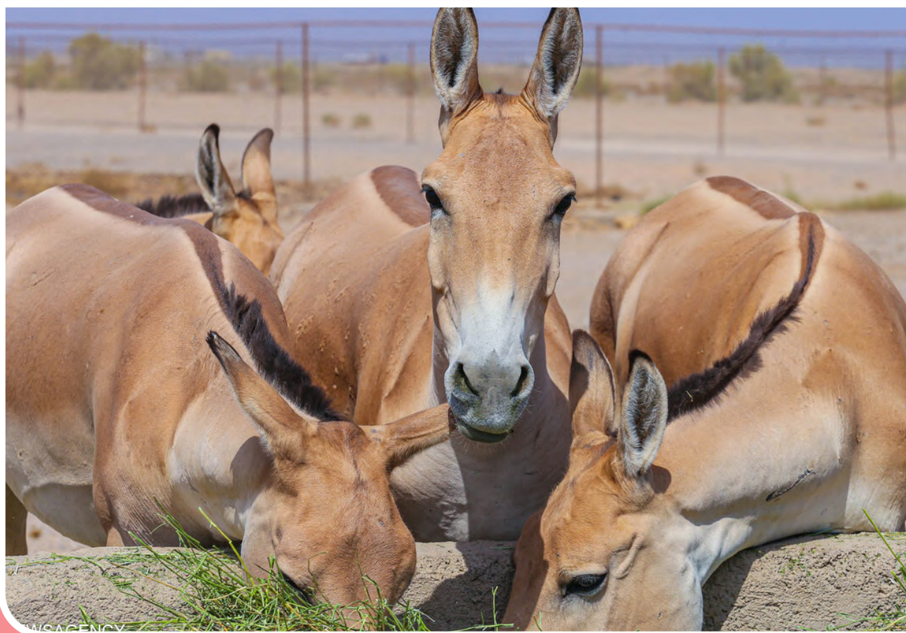
پرورش گورخر ایرانی در منطقه گوراب شهرستان مهریز/ یزد/ مهر