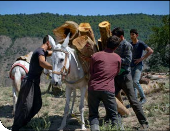
باراندازی چوب در استان فارس

او توضیح داد: «در زاگرس اقدامی برای کاهش وابستگی مردم به جنگل نشده است. بنابراین نمی‌توان انتظار داشت که قاچاق در این منطقه چندان تغییری کرده باشد.»