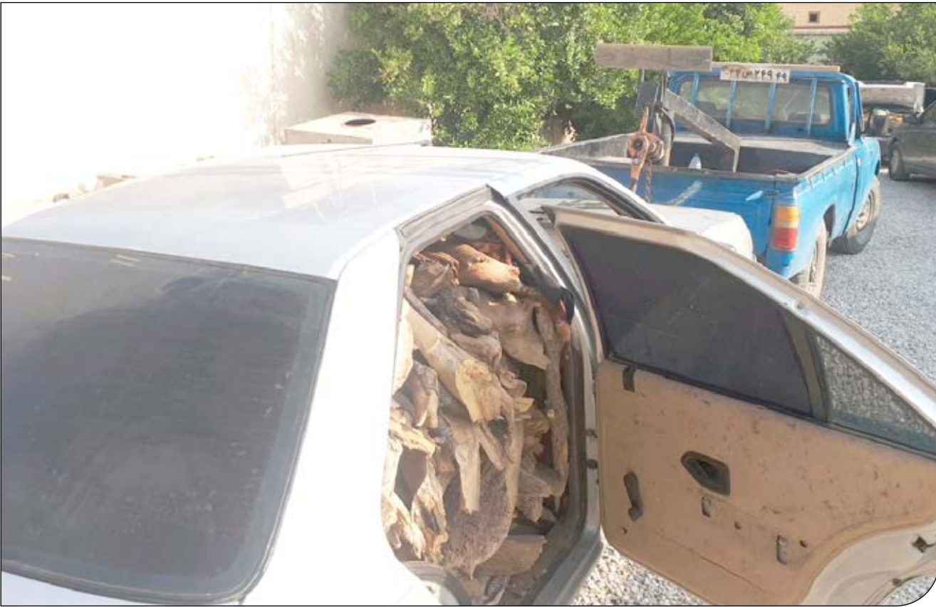
باراندازی چوب در استان فارس

کیادلبری: اقدامی برای کاهش وابستگی مردم به جنگل‌های زاگرس نشده است