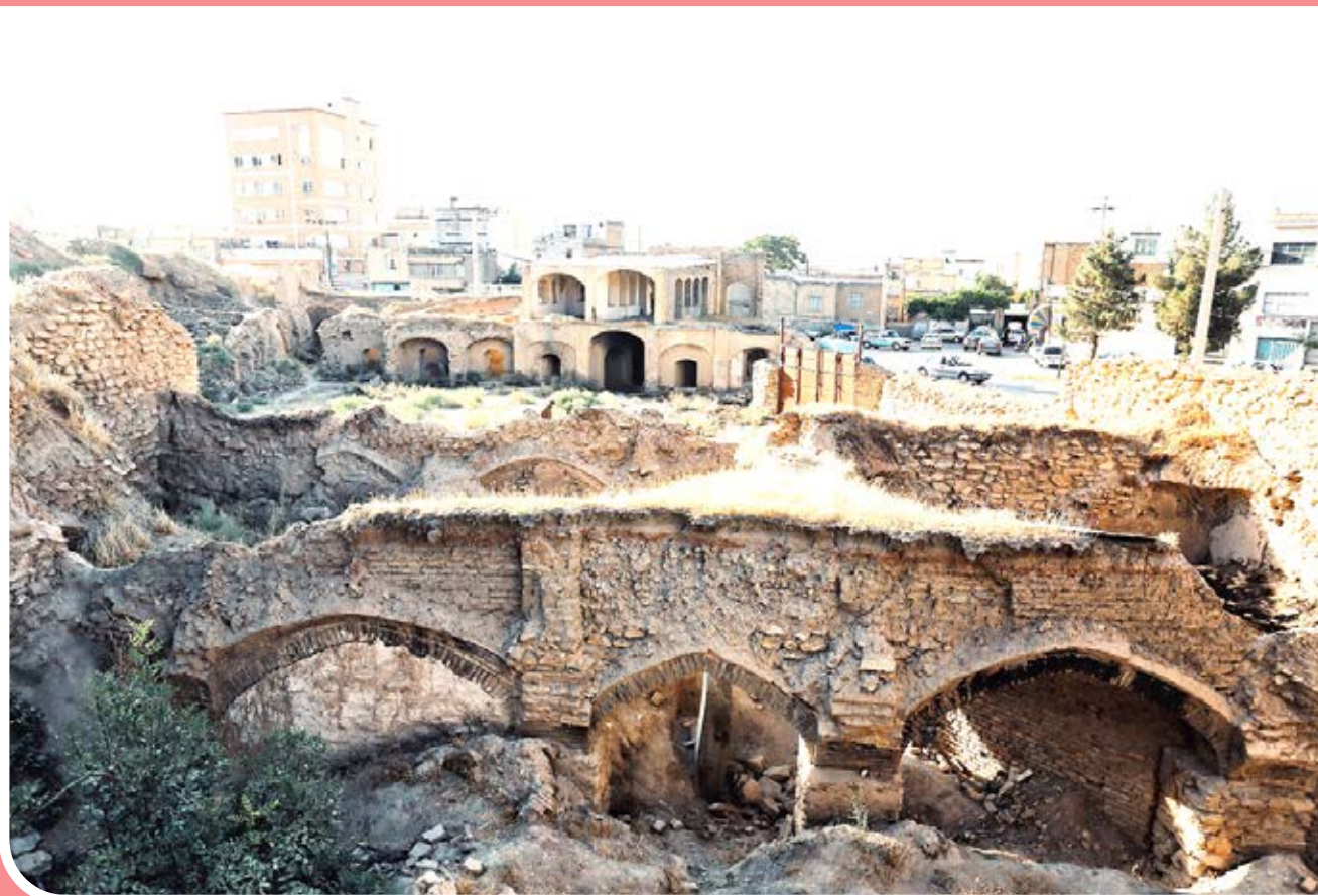
بقایای کاروانسرای زغالی‌ها در حاشیه میدان پروانه‌های همدان