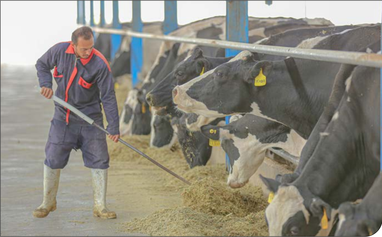
— 329 —

رئیس هیات مدیره انجمن صنفی گاوداران: خشکسالی آسیب بسیاری به صنعت دامپروری زده است غذای دام نسبت به سال گذشته ۳۰۰ تا ۵۰۰ درصد افزایش قیمت داشته است