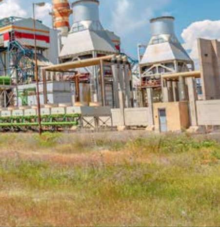
| باشگاه خبرنگاران |