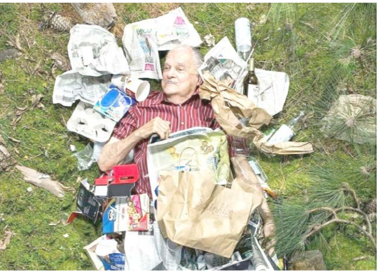
عکاسی به نام گرگ سگال بعضی از مردم را راضی کرده است که از آنها به همراه زباله‌های یک هفته‌شان عکاسی کند. / ensculture