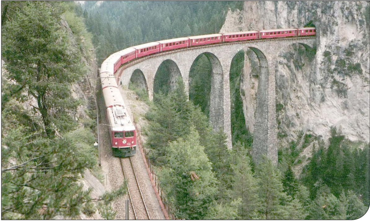
— 12 —

رئیس‌جمهور منتخب در ادامه به موضوع لزوم پرداخت عوققات پیمانکاران حوزه نیرو اشاره کرد و گفت: یکی از مسائل محوری در دولت سیزدهم تلاش برای بازسازی اعتماد بین دولت و بخش خصوصی و تعاونی است و پرداخت مطالبات پیمانکاران به طرق مقتضی، از جمله در حوزه نیرو جزو اقدامات اعتمادسازی است که در دولت آینده مورد توجه جدی قرار خواهد داشت. راهکارهای پرداخت مطالبات پیمانکاران از جمله راهکارهای غیرریالی نظیر تهاتر و اعطای امتیاز به آنها نیز بررسی شود.