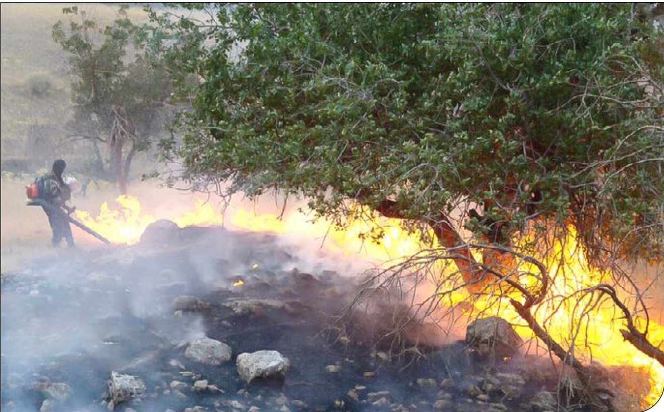
تصاویر: [عکس] [عکس]

رئیس اداره منابع طبیعی و آبخیزداری دزفول: دلیل آتش‌سوزی مشکلات اجتماعی قدیمی برخی افراد است