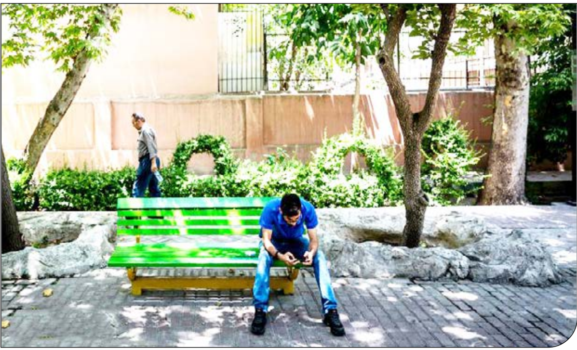
از اس عکس تهران

بر اساس این قانون اطفال و نوجوانان دارای وضعیت خاص، از جمله دارای اعتیاد، کم توانی جسمی یا ذهنی، مبتلا به بیماری‌های خاص یا اختلال هویت جنسی یا روانی نیز به مراکز تخصصی ارجاع می‌شوند