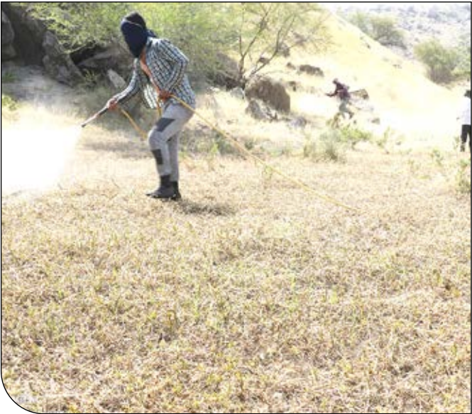
ملخ‌های صحرایی در استان‌های خوزستان، بوشهر و هرمزگان.

ملخ‌های صحرایی در مسیر حرکت خود با تغذیه از سبزیه‌های مختلف جنگل‌ها، باغ‌های میوه، علوفه، غلات، صیفی و مراتع را از بین می‌برند و با توجه به قدرت تخریبی بالایی که دارند باعث قحطی در منطقه مورد هجوم می‌شوند. ملخ صحرایی خطرناک‌ترین آفت محصولات کشاورزی در بین ۱۰۰۰ آفت اقتصادی در دنیا به حساب می‌آید. شواهد نشان می‌دهد هجوم این آفت به کشورهای پیامدهای اقتصادی، اجتماعی و محیط زیستی فراوانی به همراه داشته است.