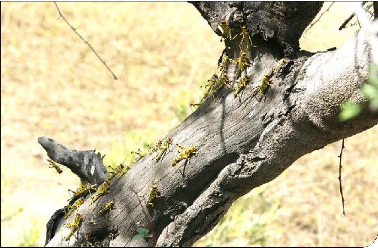
ملخ‌های صحرایی در استان‌های خوزستان، بوشهر و هرمزگان.

سازمان حفظ نباتات: در سال زراعی جاری ۱۹ هزار هکتار عملیات مبارزه با آفت ملخ صحرایی انجام شده است